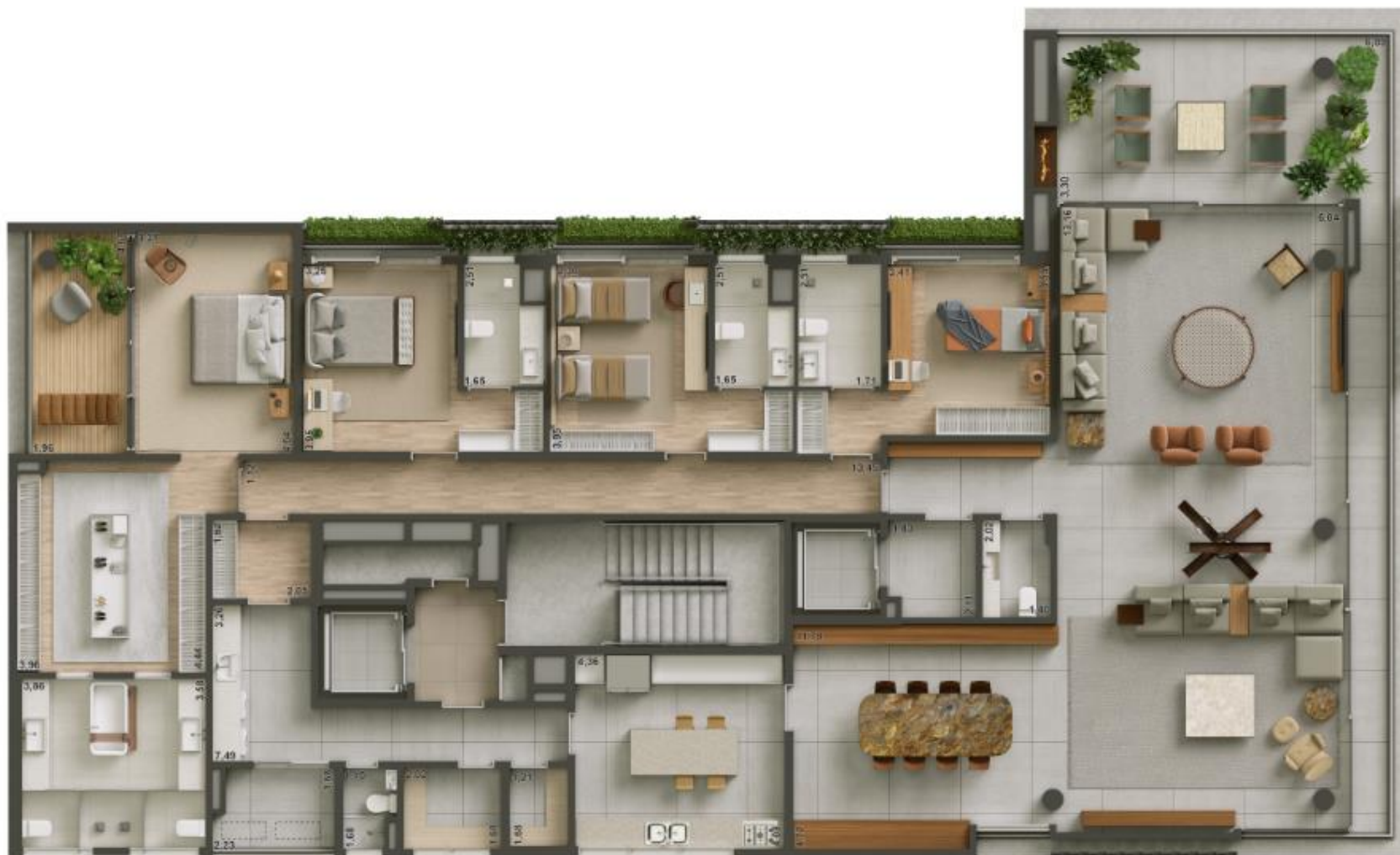
Planta Tipo - 4 suítes