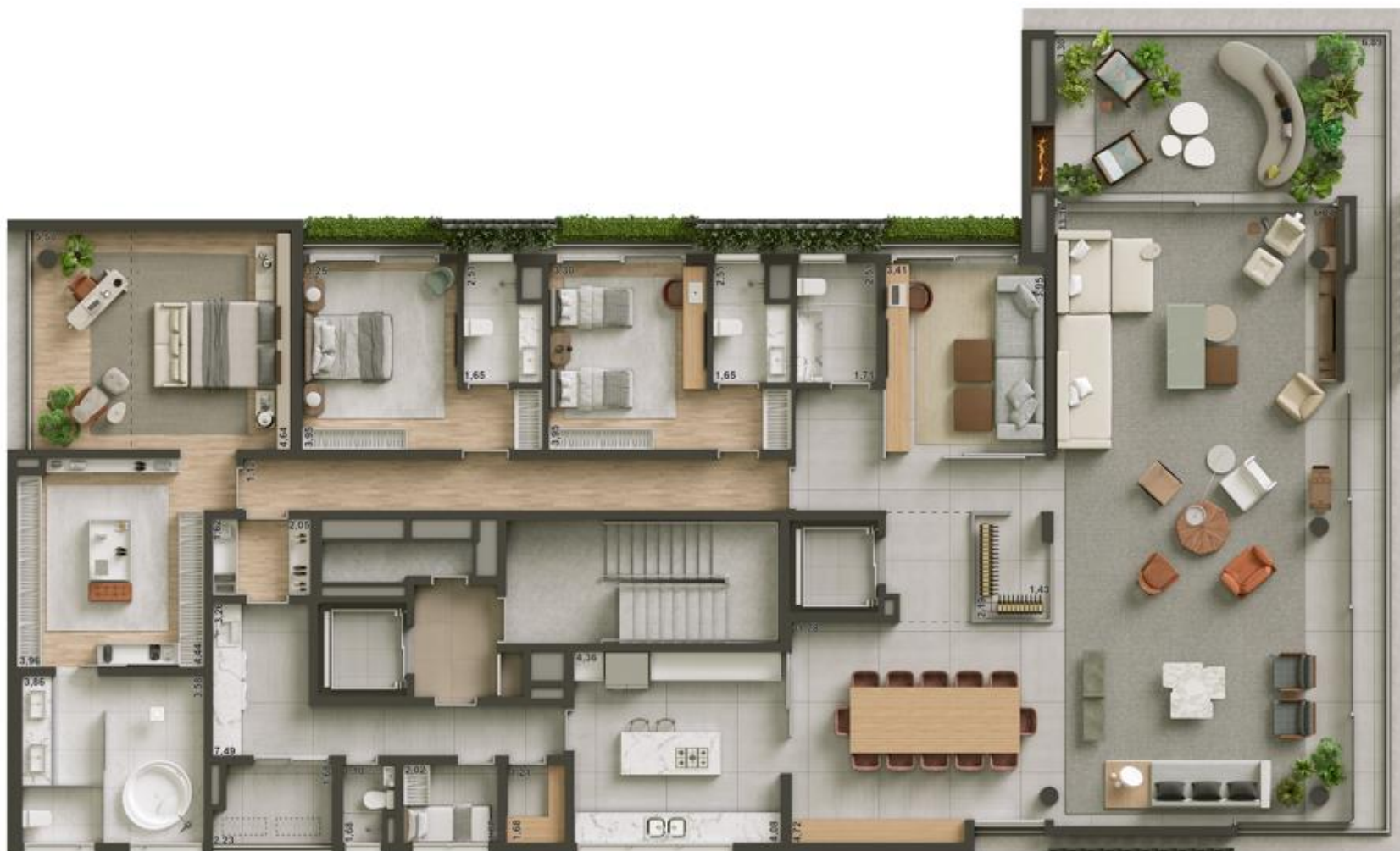
Planta Tipo - Ampliada