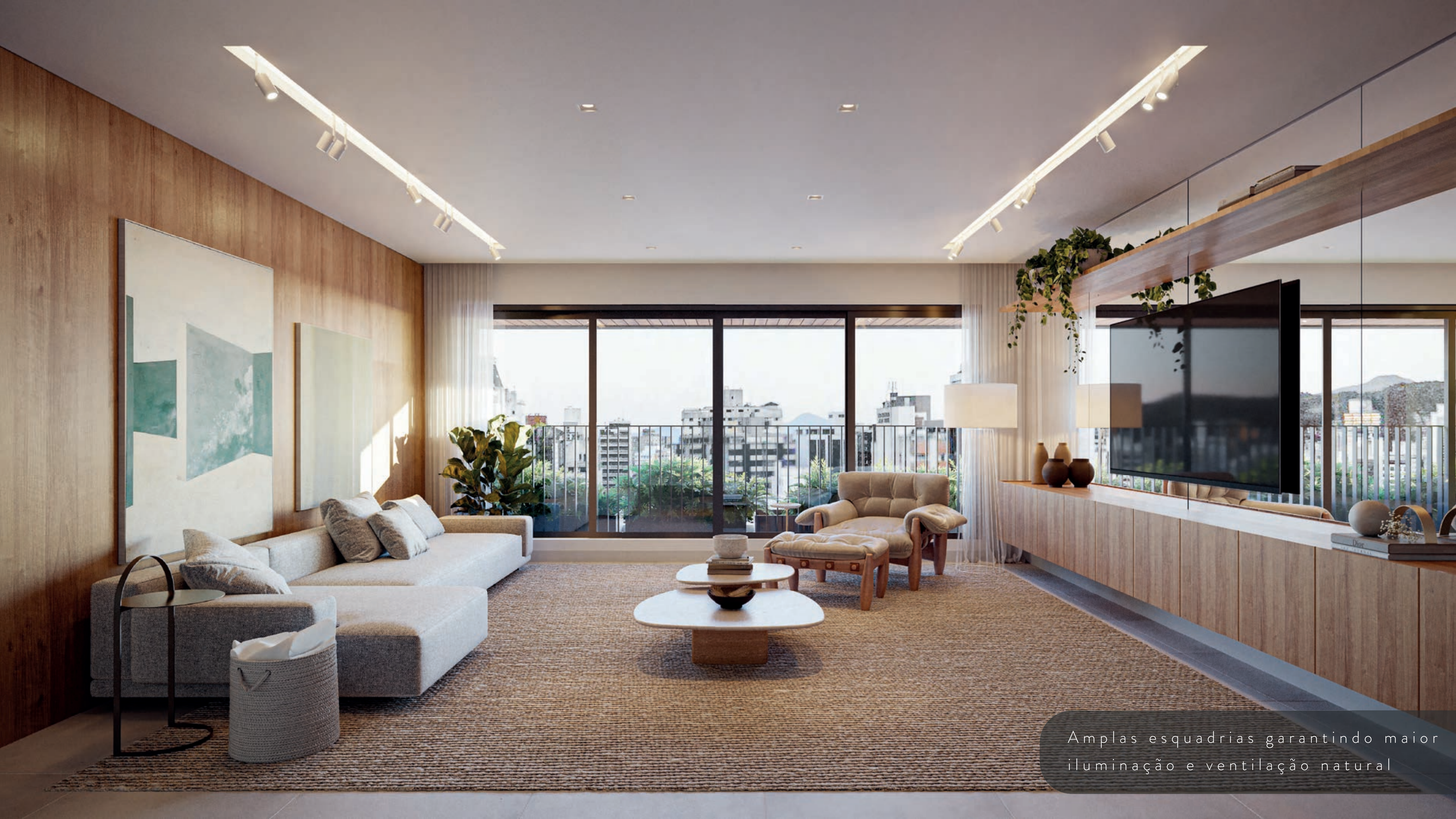
Amplas esquadrias garantindo maior iluminação e ventilação natural