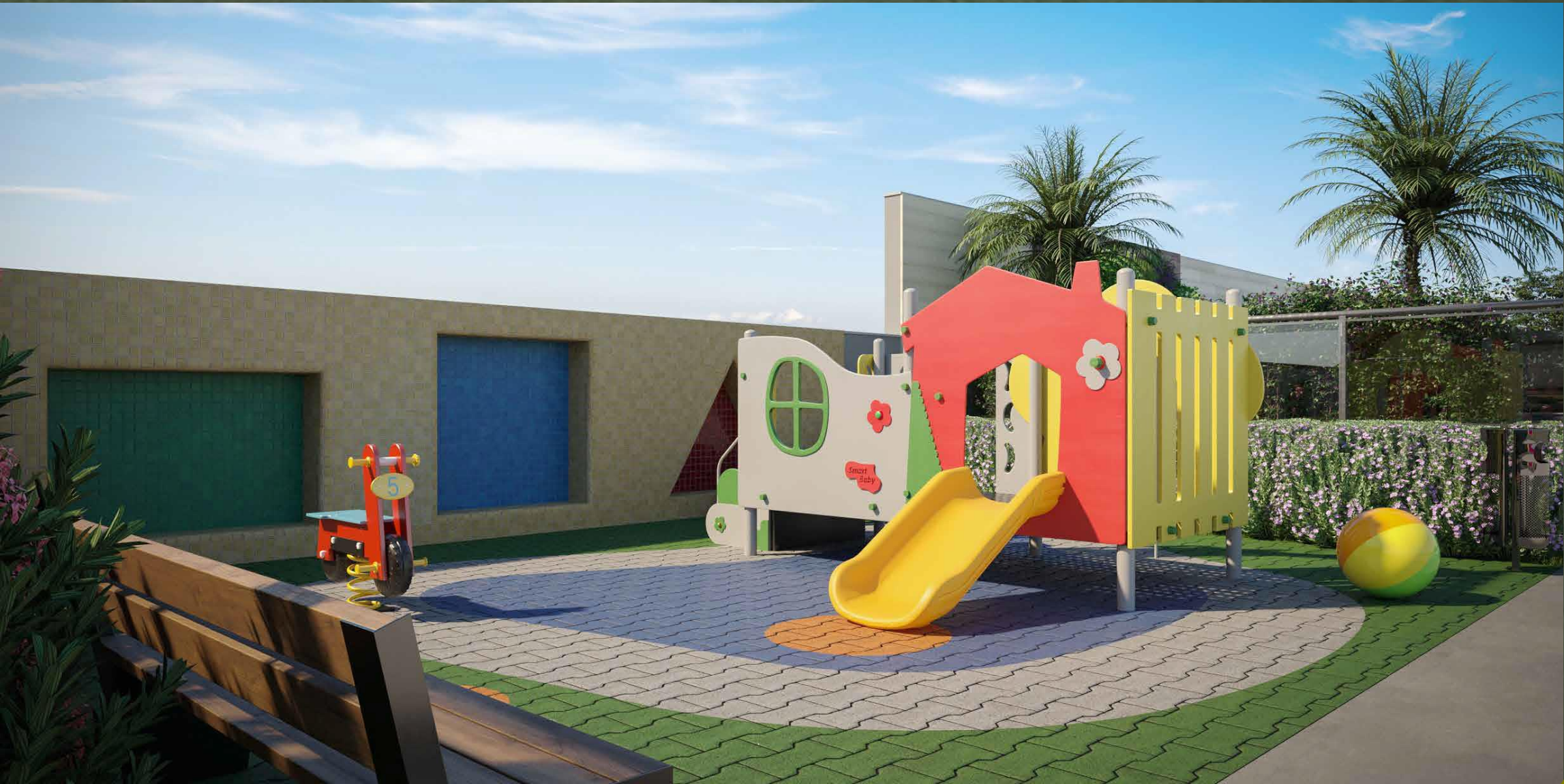
IMAGEM SUJEITA A ALTERAÇÃO