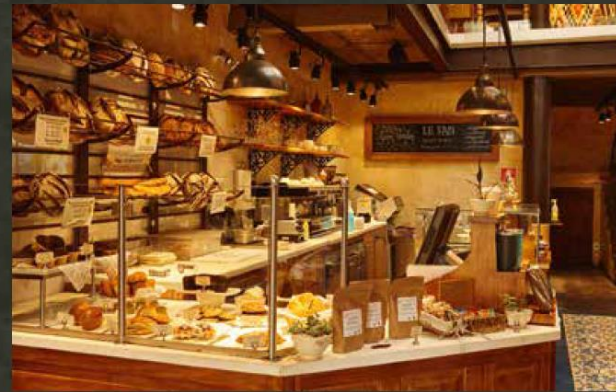
LE PAIN QUOTIDIEN