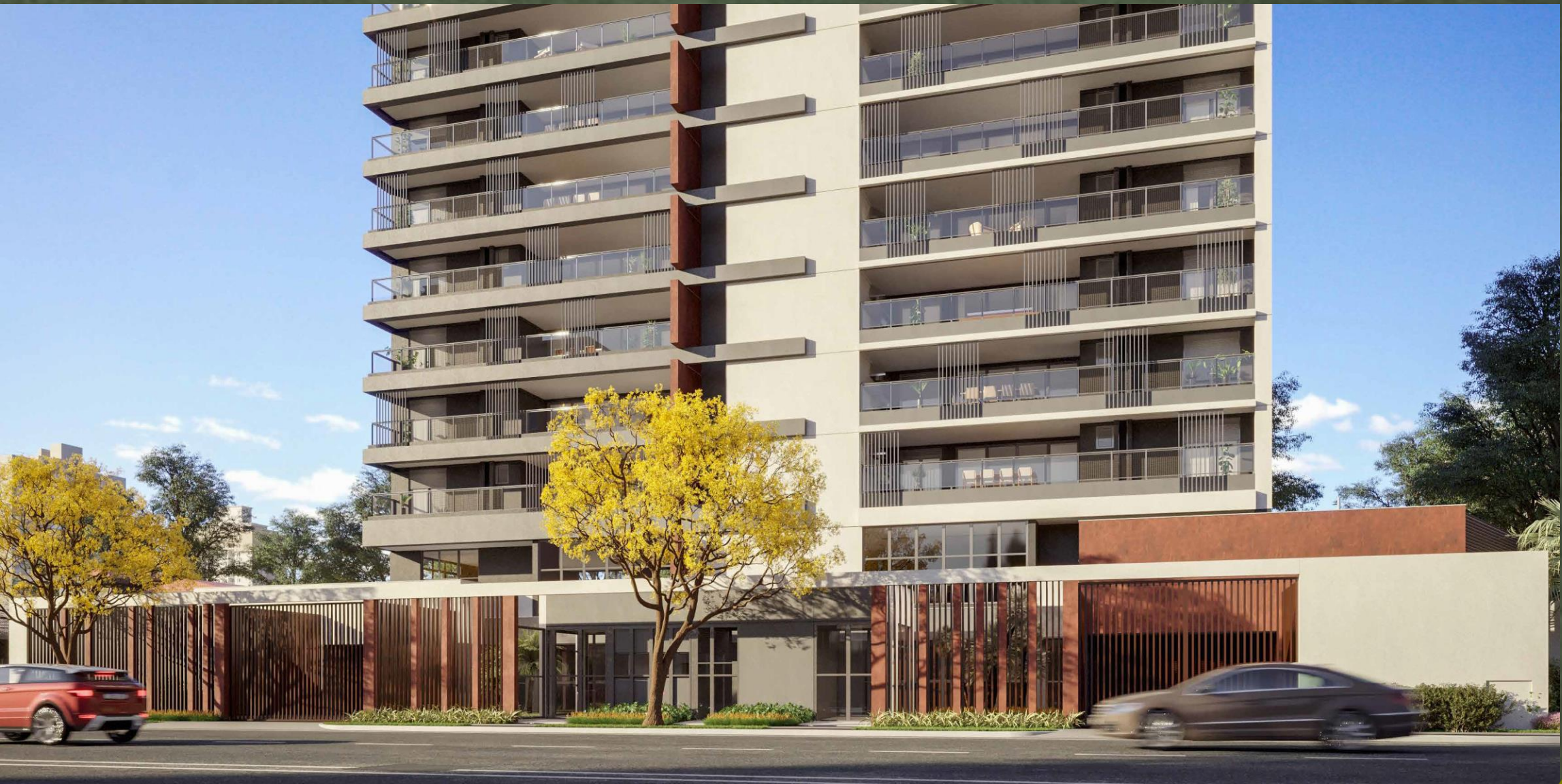
IMAGEM SUJEITA A ALTERAÇÃO