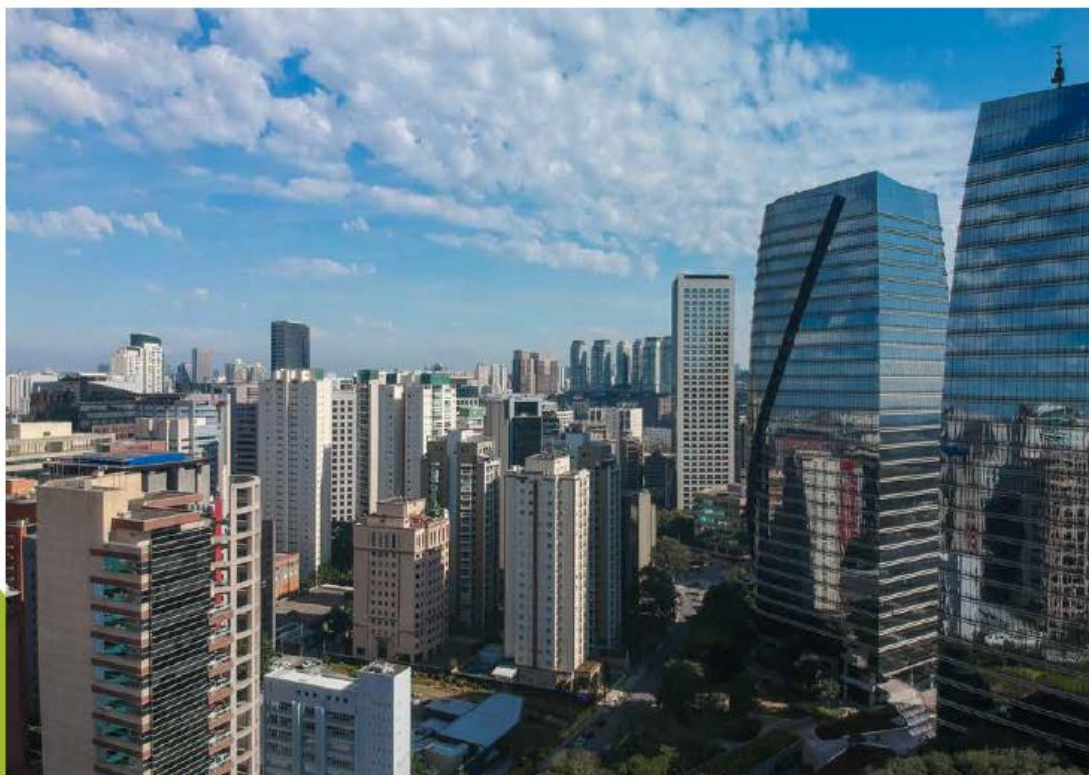
Avenida Juscelino Kubitschek

VOCÊ EXATAMENTE ONDE DEVERIA ESTAR: ENTRE OS NEGÓCIOS E O LAZER.