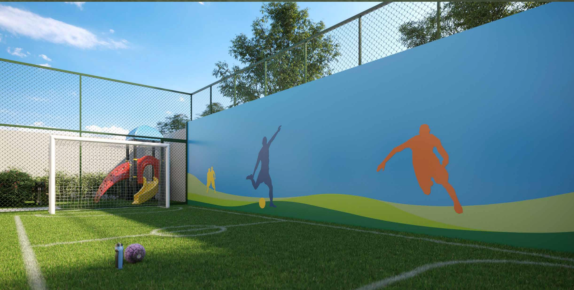
IMAGEM SUJEITA A ALTERAÇÃO