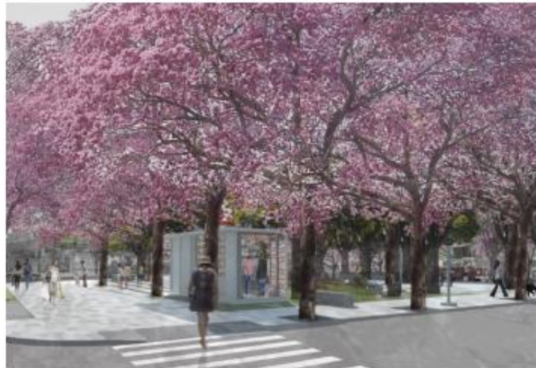
Praça Rua Egito