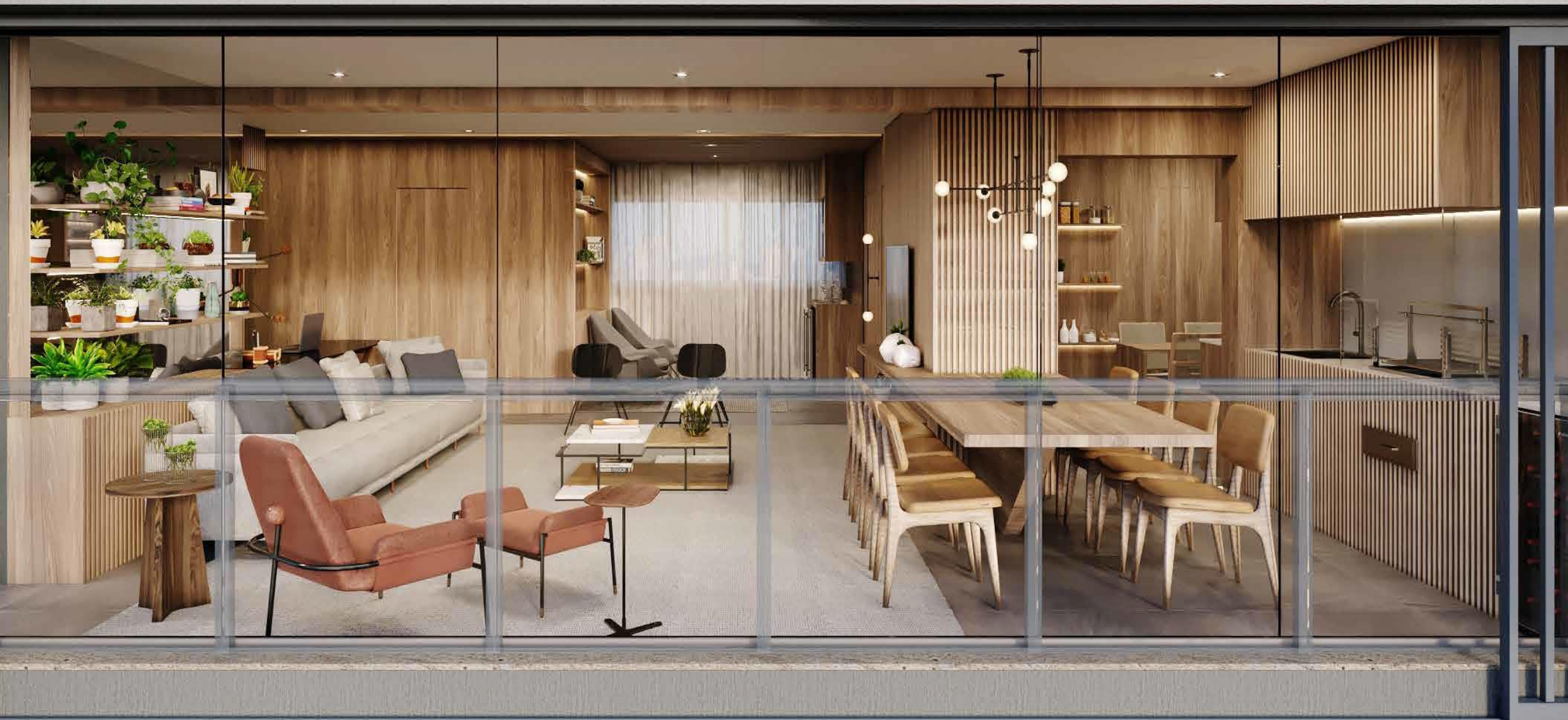
IMAGEM SUJEITA A ALTERAÇÃO