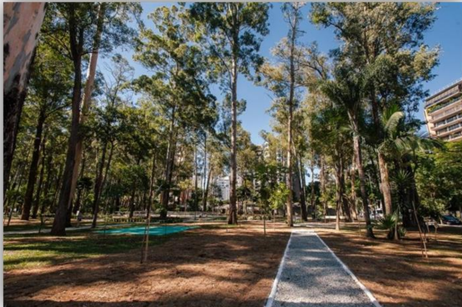
Praça Cidade de Milão