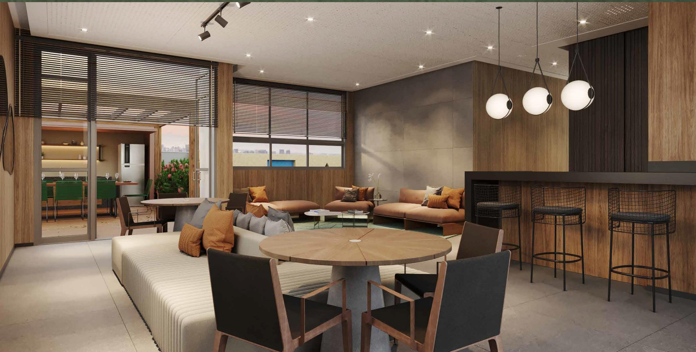
IMAGEM SUJEITA A ALTERAÇÃO