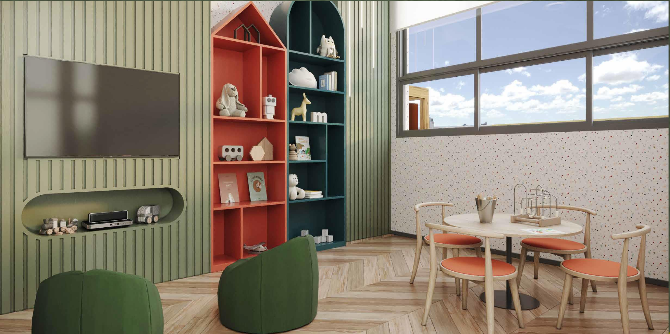
IMAGEM SUJEITA A ALTERAÇÃO