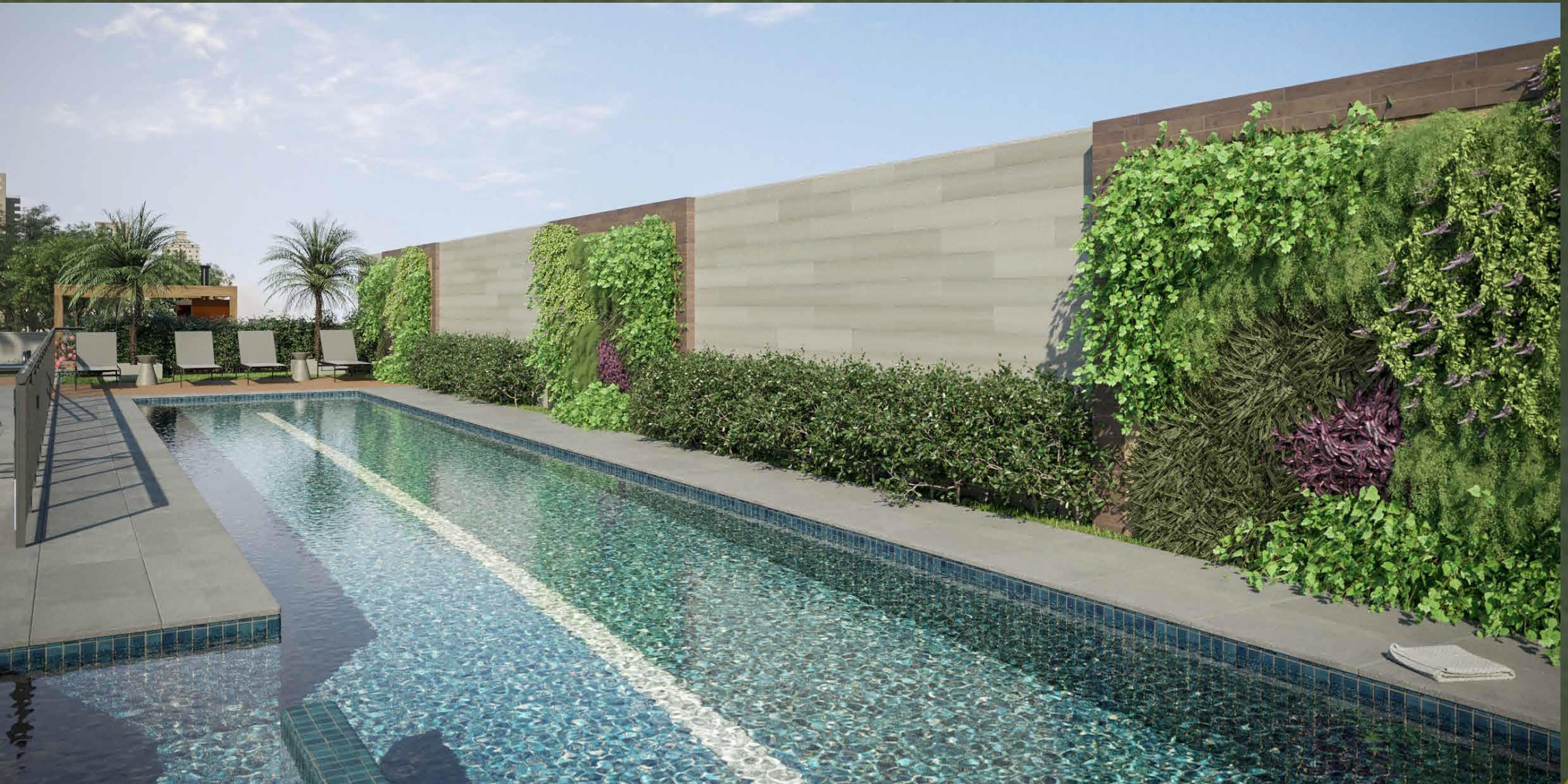
IMAGEM SUJEITA A ALTERAÇÃO