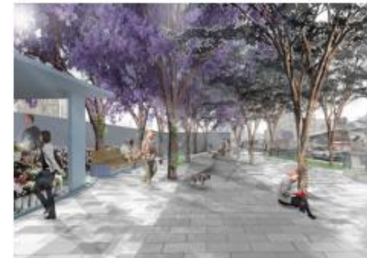
Praças ao longo da Avenida