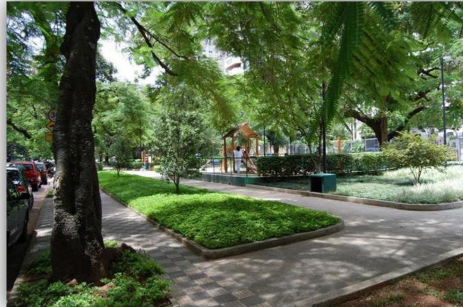
Praça Pereira Coutinho