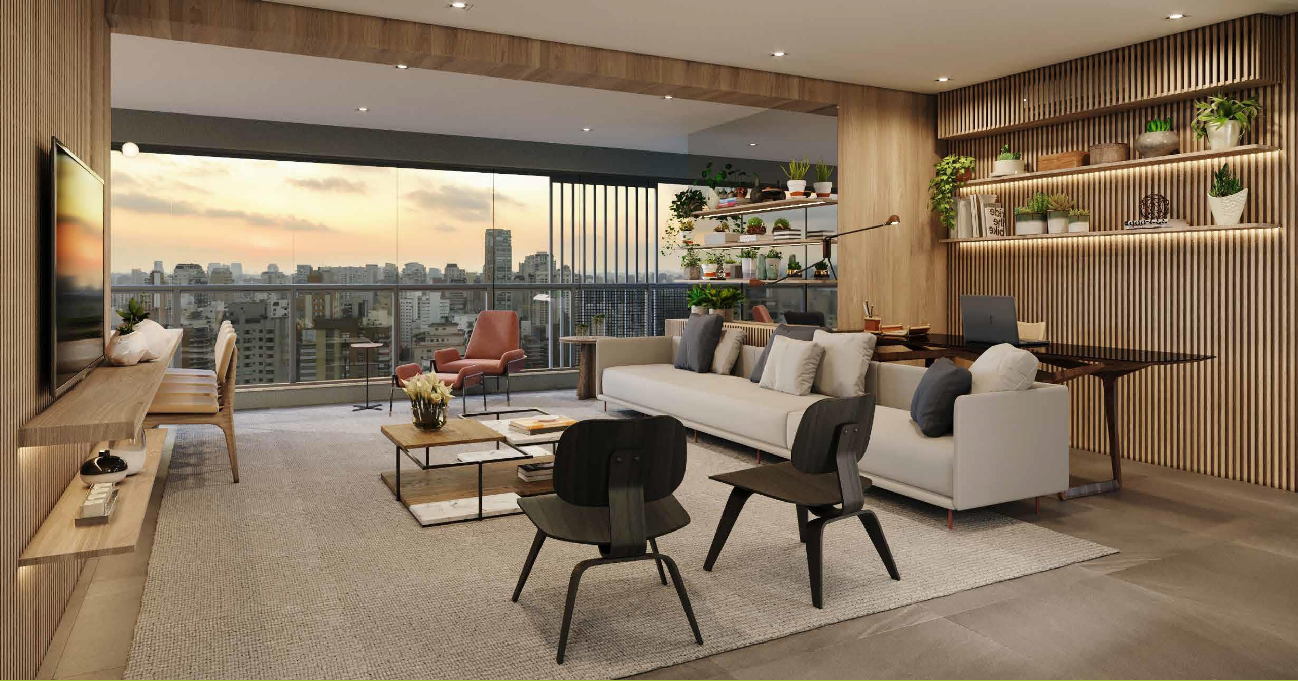
IMAGEM SUJEITA A ALTERAÇÃO