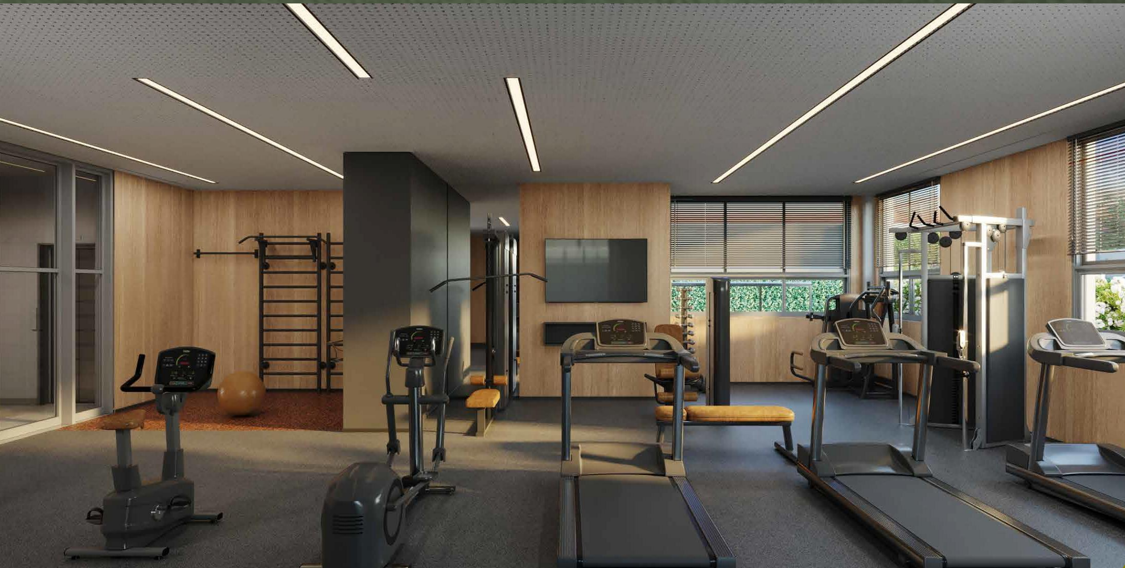
IMAGEM SUJEITA A ALTERAÇÃO