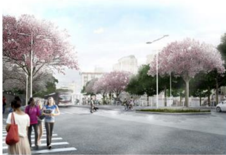
Cruzamento Rua Afonso Brás

Com a revitalização da Santo Amaro a região ganhará mais uma praça, a Praça Egito ficará localizada na Rua Egito, e estará posicionada em frente ao empreendimento, proporcionando aos moradores mais uma opção de interação com a natureza.