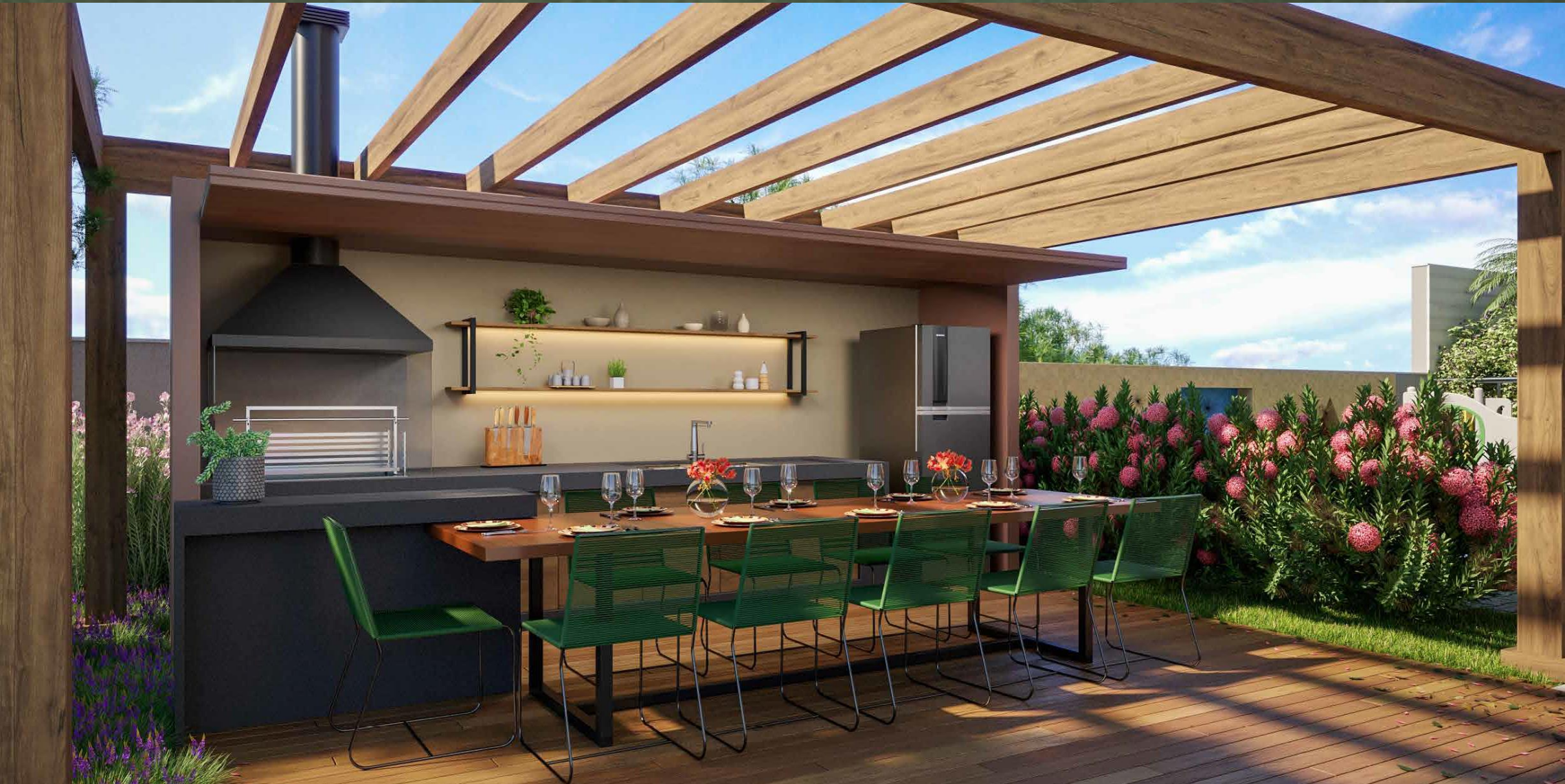
IMAGEM SUJEITA A ALTERAÇÃO