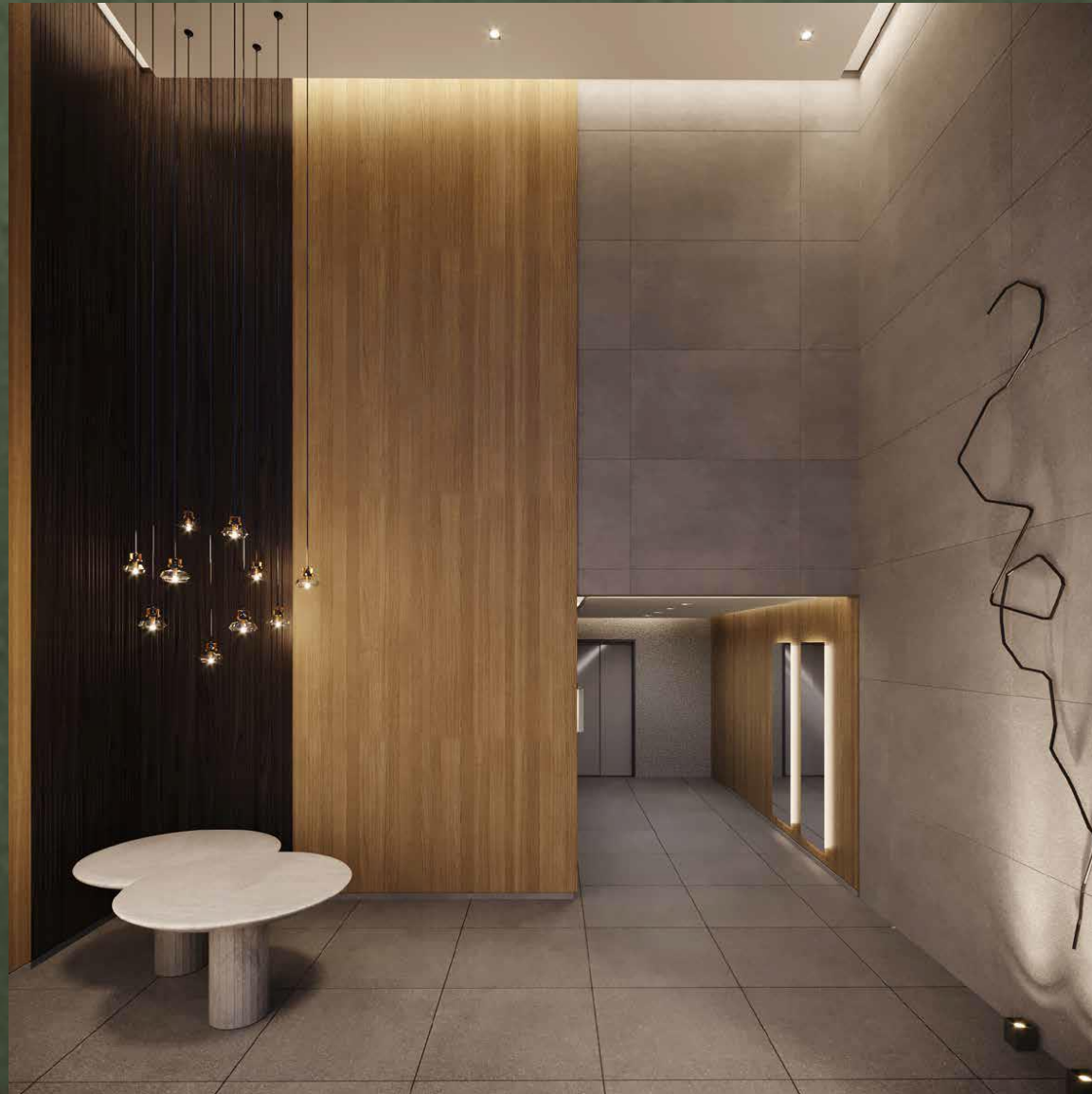
IMAGEM SUJEITA A ALTERAÇÃO