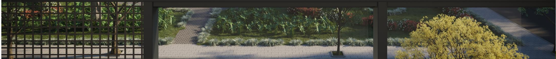
Imagem preliminar. Sujeita a alteração.