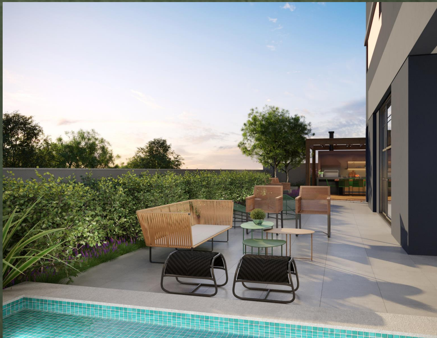
IMAGEM SUJEITA A ALTERAÇÃO