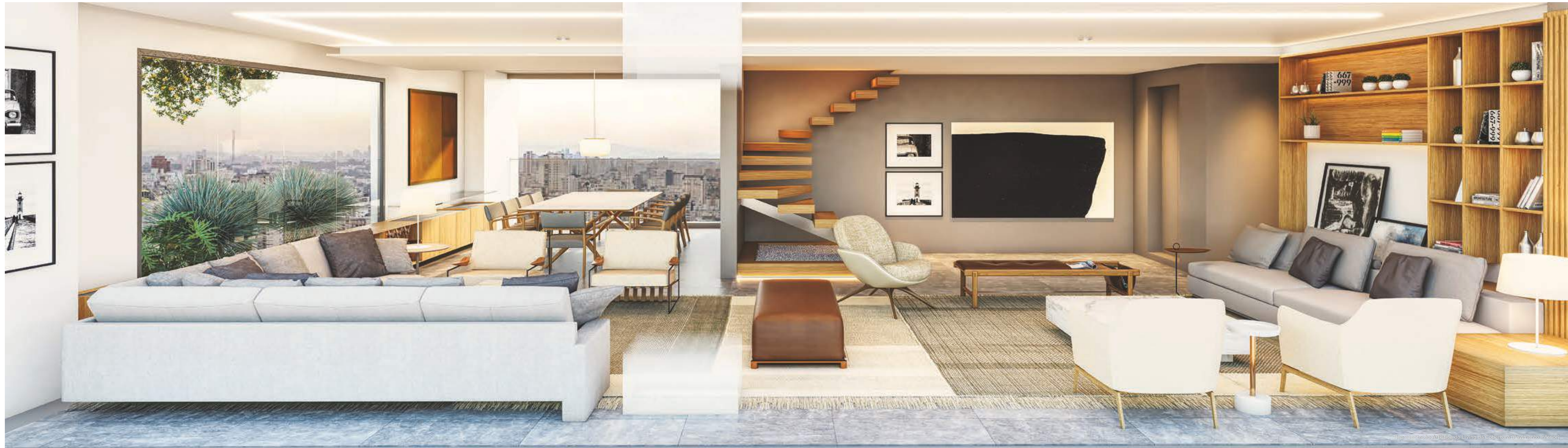
Representação Artística do Living da Cobertura (Pavimento Inferior)