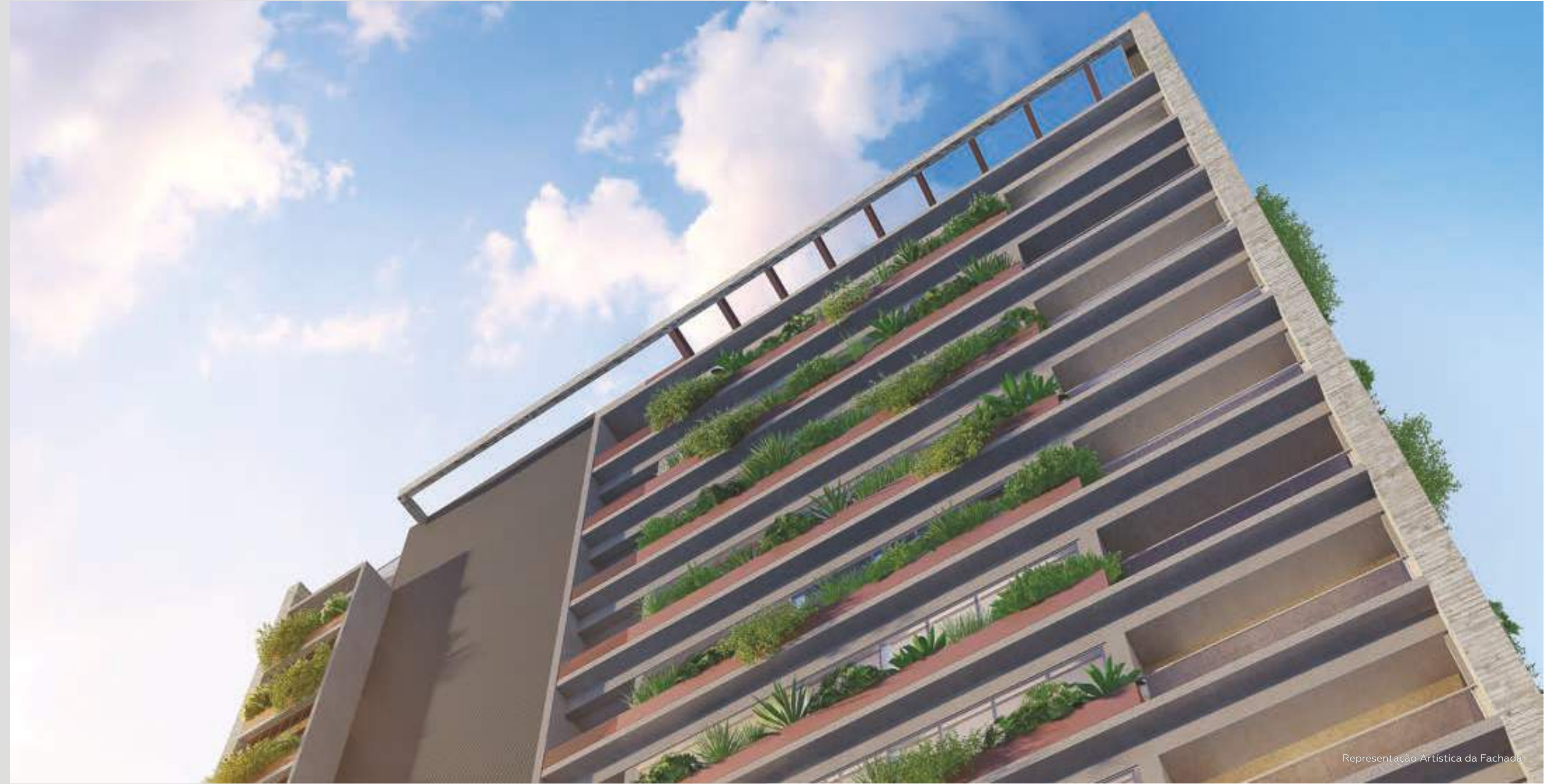
Representação Artística da Fachada