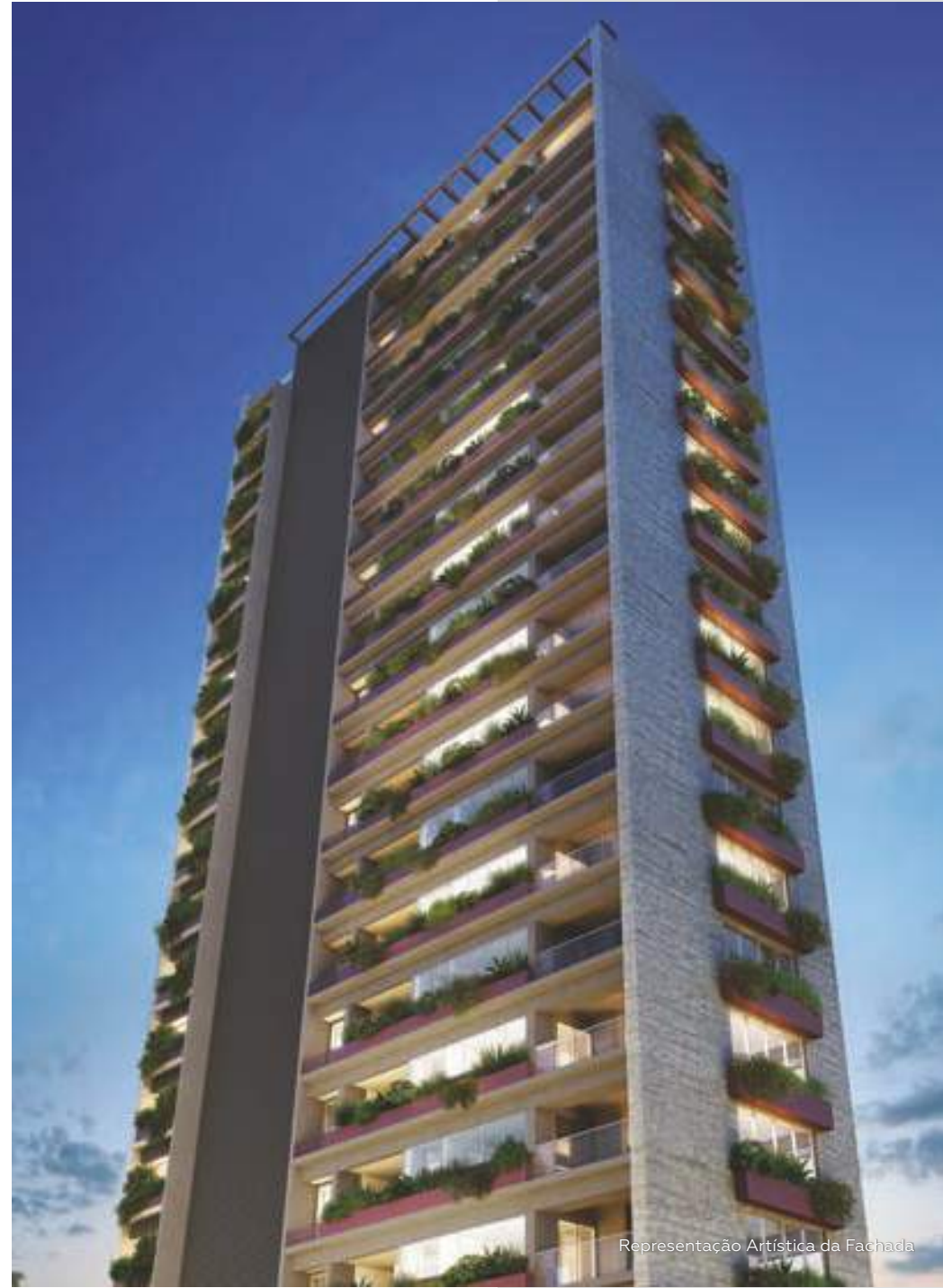
Representação Artística da Fachada