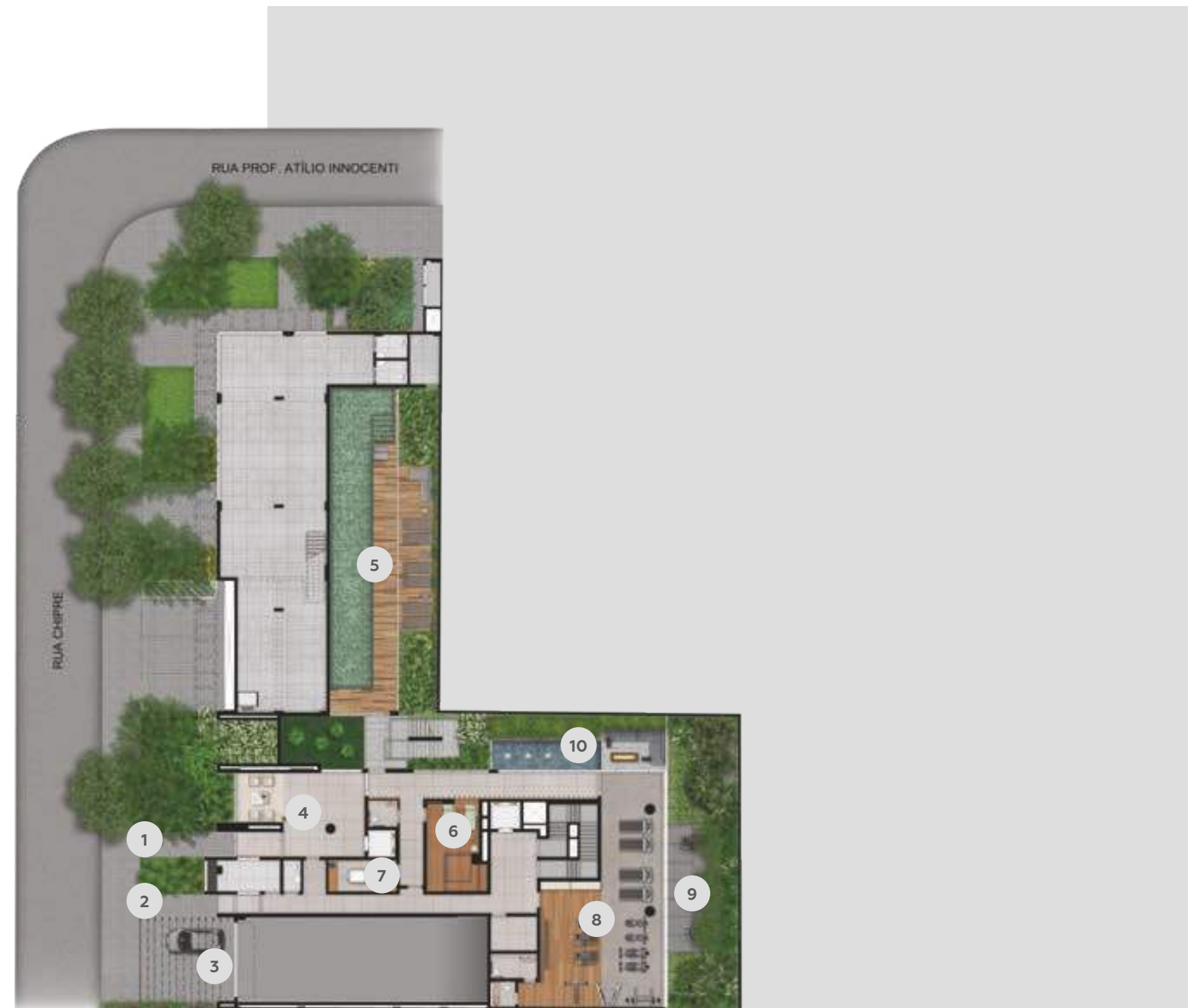
Ilustração artística da Implantação – Térreo

Os revestimentos, mobiliários e equipamentos representados são meramente ilustrativos. O empreendimento será entregue conforme memorial descritivo e projeto específico de decoração.