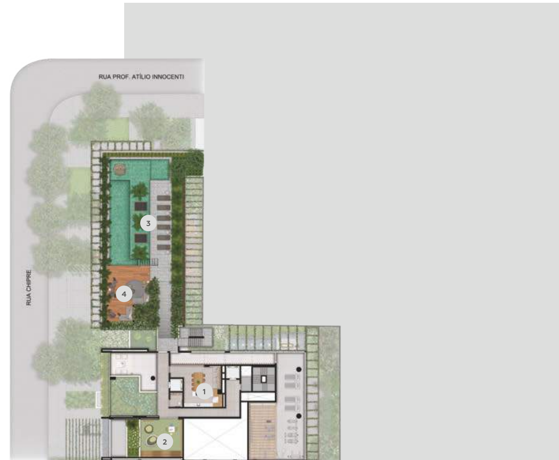
Ilustração artística da Implantação – 2º pavimento