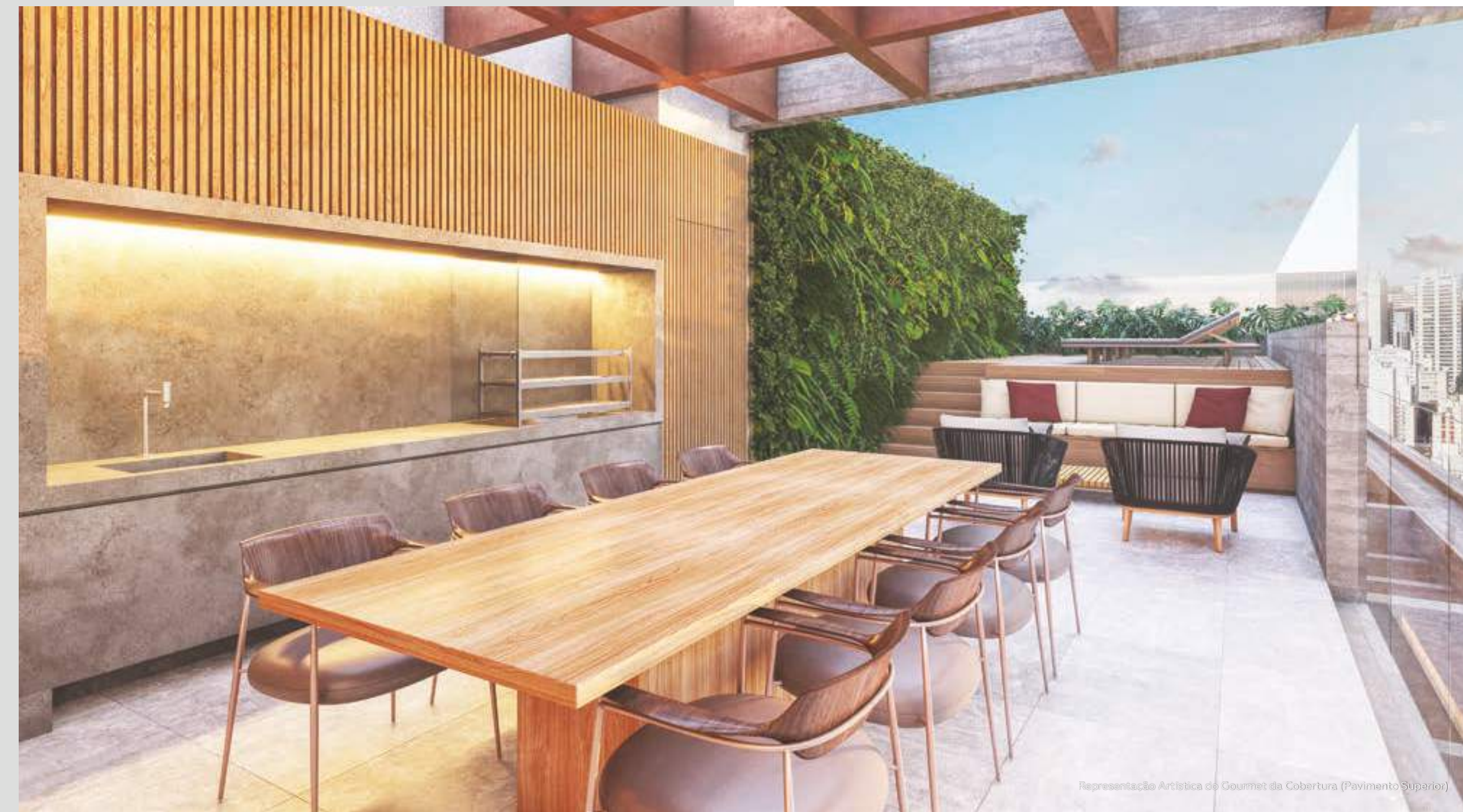
Representação Artística do Gourmet da Cobertura (Pavimento Superior)