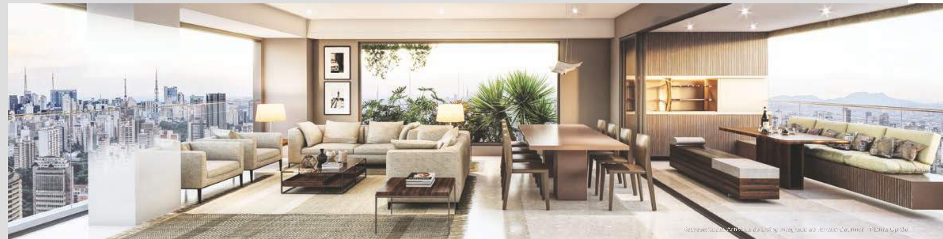
Representação Artística do Living Integrado ao Terraço Gourmet - Planta Opção 1

Os móveis, utensílios e objetos de decoração não serão entregues, e são uma mera sugestão de decoração. Os revestimentos, bancadas, louças e metais são ilustrativos e as unidades serão entregues conforme informações constantes no memorial descritivo que integrará o compromisso de compra e venda. Medidas livres entre paredes sujeitas a variações em virtude da execução e acabamentos que serão aplicados. O material aqui apresentado poderá sofrer ajustes em virtude de eventuais compatibilizações técnicas que possam ocorrer no desenvolvimento do projeto.