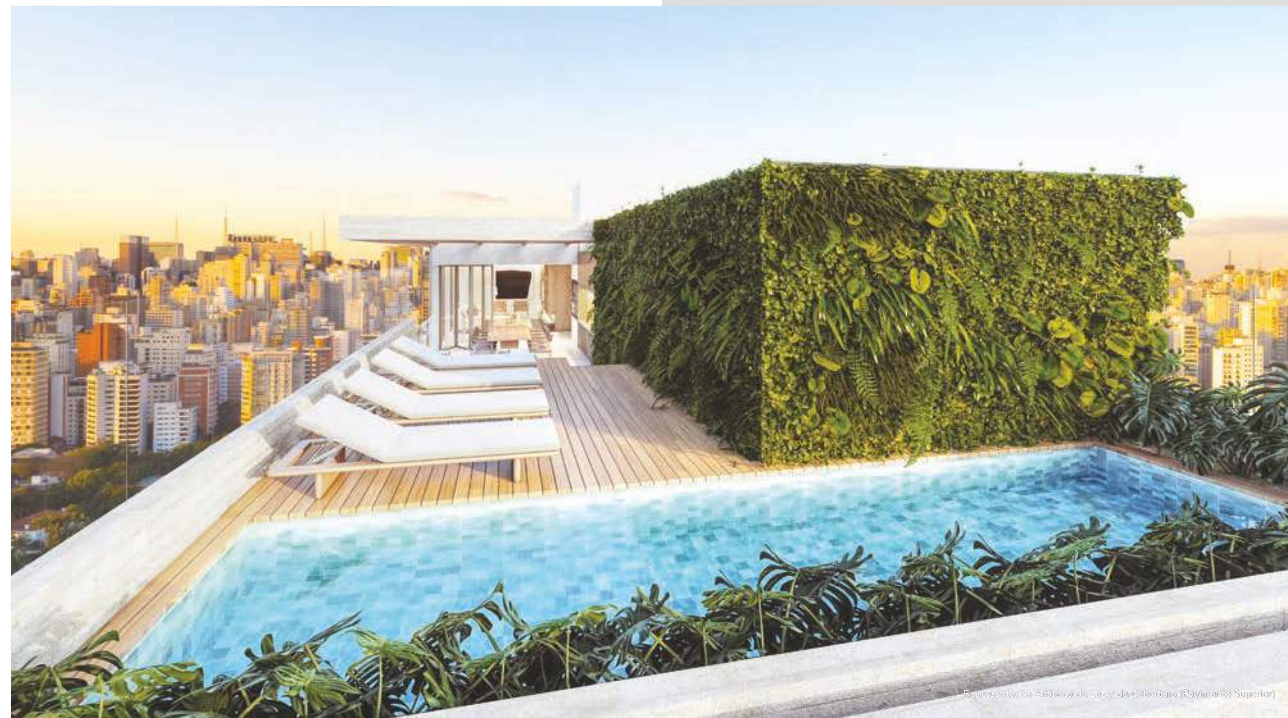
Representação Artística do Lazer da Cobertura (Pavimento Superior)