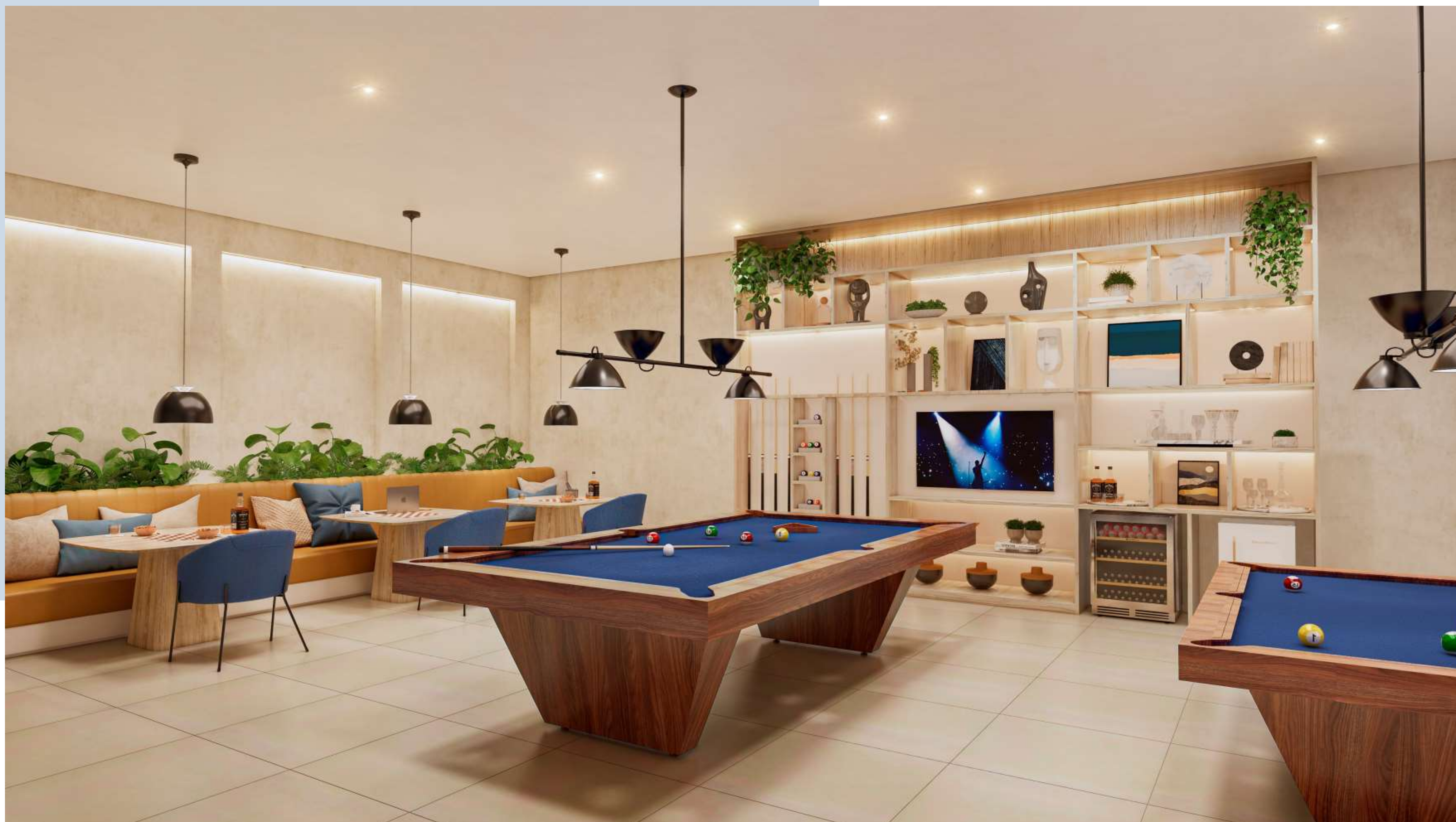
Salão de Jogos