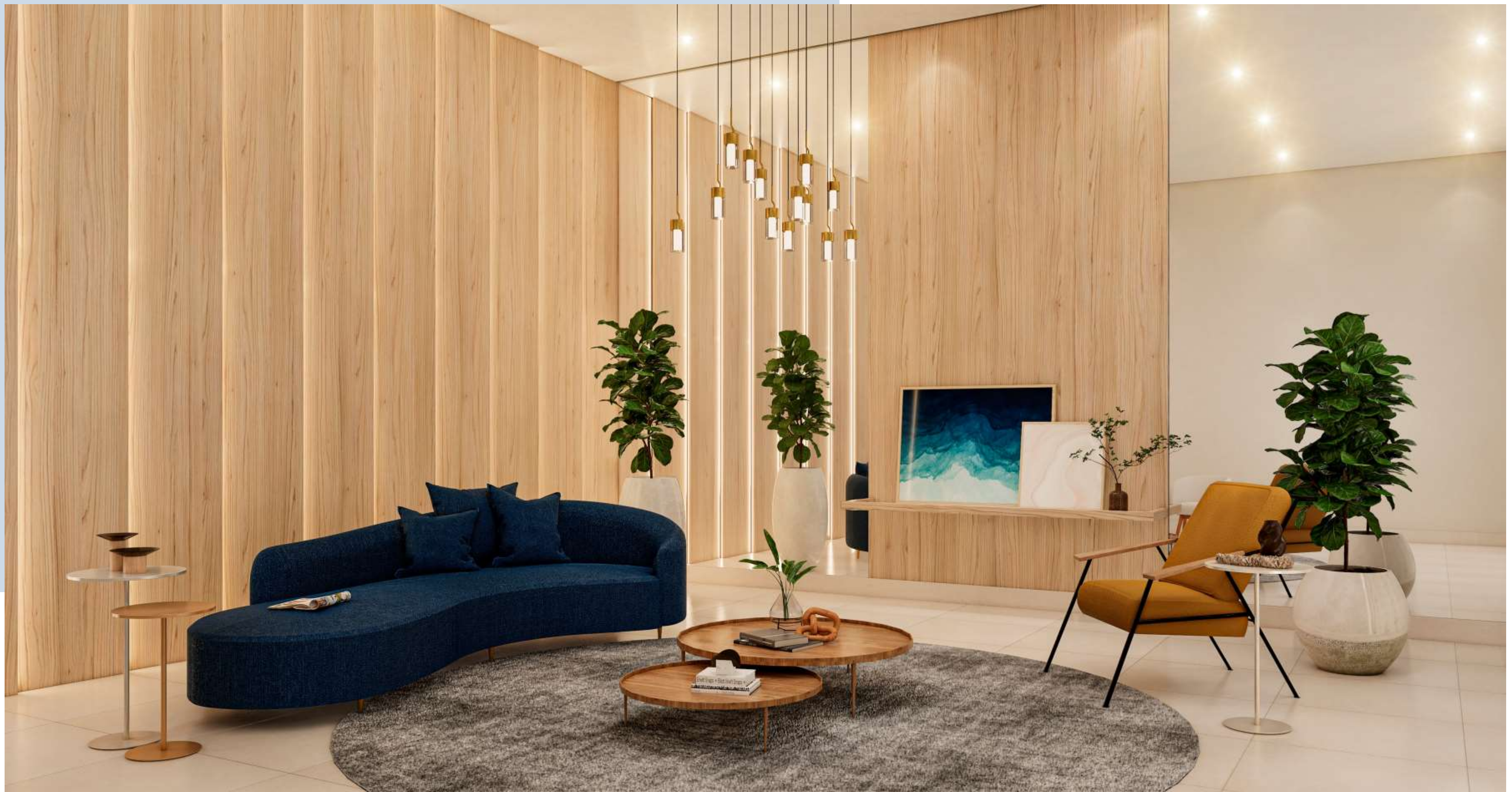
Lobby de Entrada