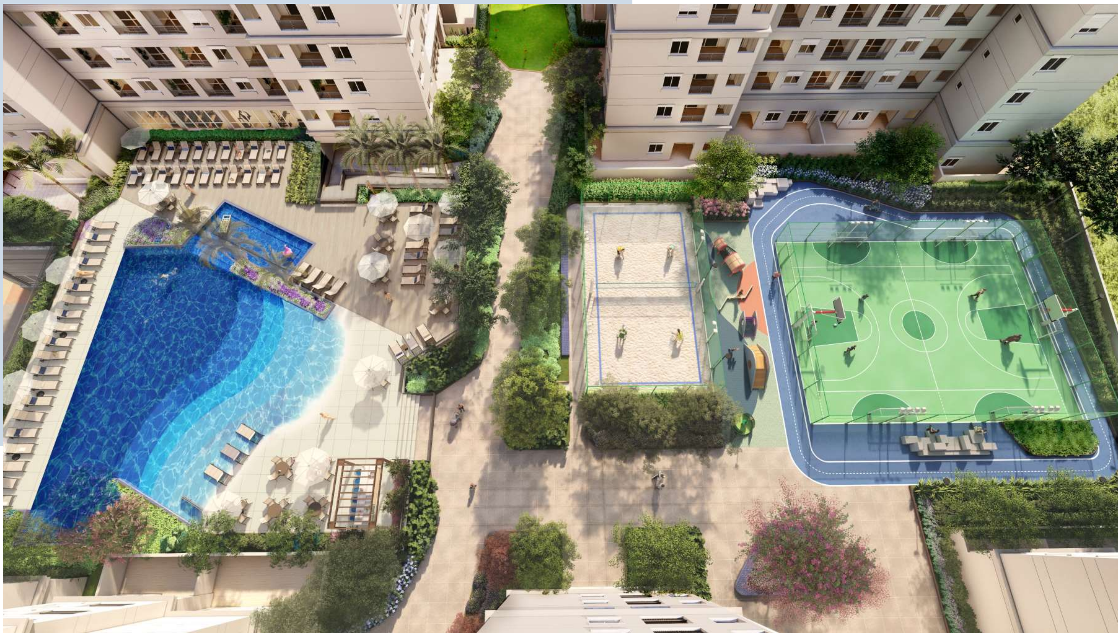
Vista Aérea Blue