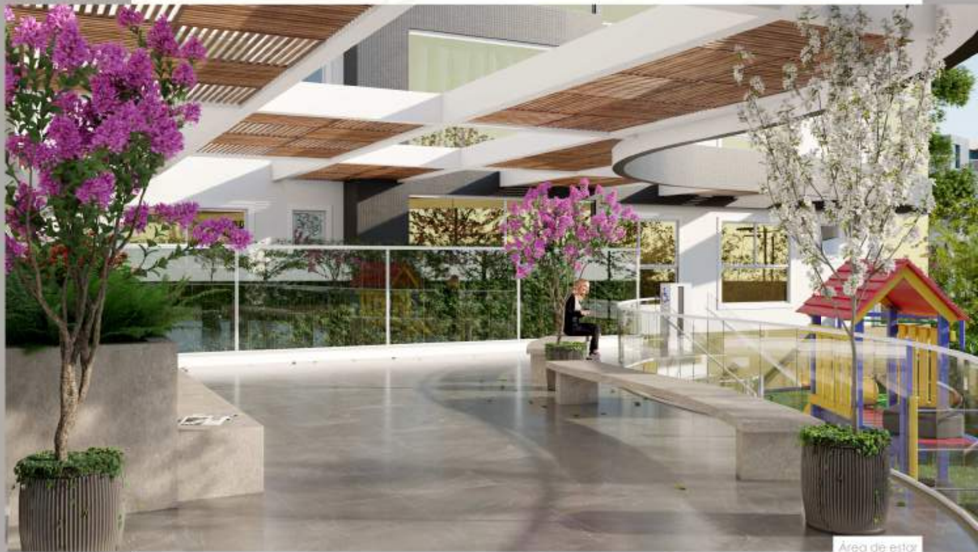
Área de estar

A área de estar completa o espaço externo do empreendimento, proporcionando um ambiente tranquilo e agradável, que anexo à área de preservação permanente exclusiva e playground reserva um lugar para momentos de descanso, leitura, trabalho e interação social.