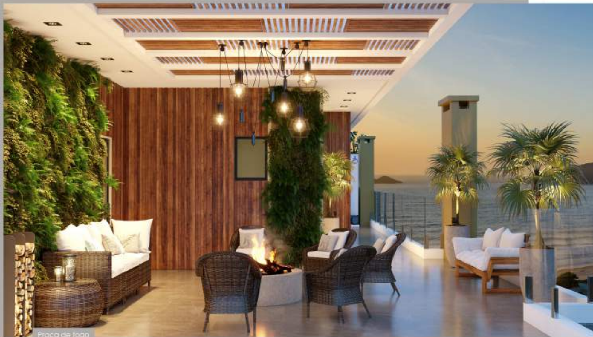
Praça de fogo