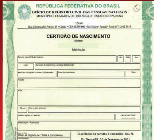
Exemplo de Certidão de Nascimento