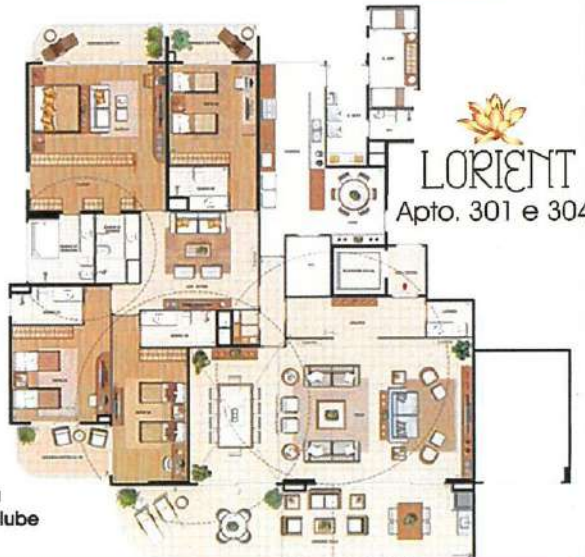
LORIENT Apto. 301 e 304

5 Edifícios com 15 pavimentos / Dependência Todos os aptos. com 4 suíte