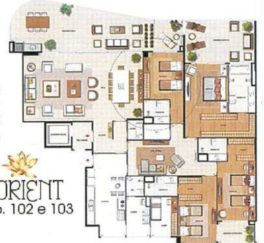
LORIENT Apto. 102 e 103