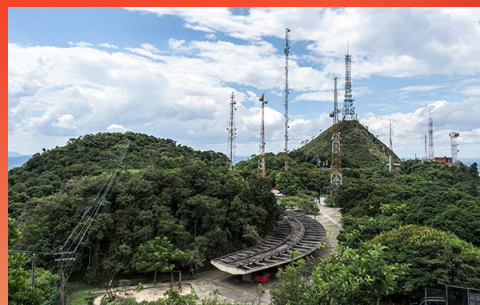
PARQUE PICO DO JARAGUÁ