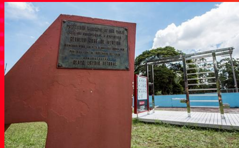
CENTRO ESPORTIVO PIRITUBA