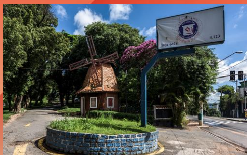
CASA DE NASSAU