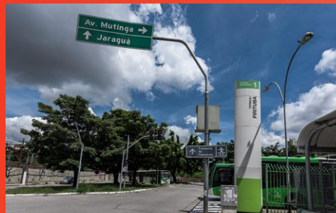
TERMINAL DE ÔNIBUS PIRITUBA