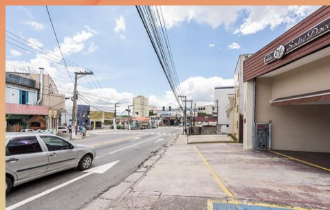
SODIÉ AV. MUTINGA

O privilégio de morar com muitas facilidades por perto.