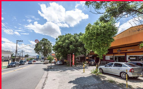
MINI EXTRA - AV. MUTINGA