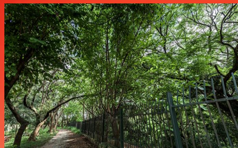
PARQUE SÃO DOMINGOS