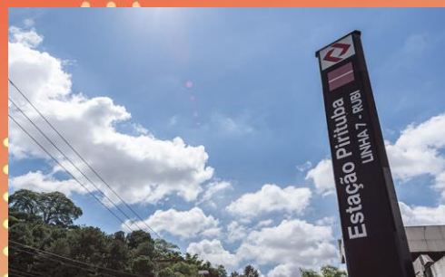
ESTAÇÃO PITUTUBA CPTM