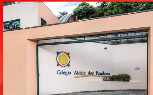
COLÉGIO ALDEIA DOS PANDAVAS