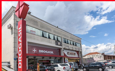
DROGASIL - AV. MUTINGA