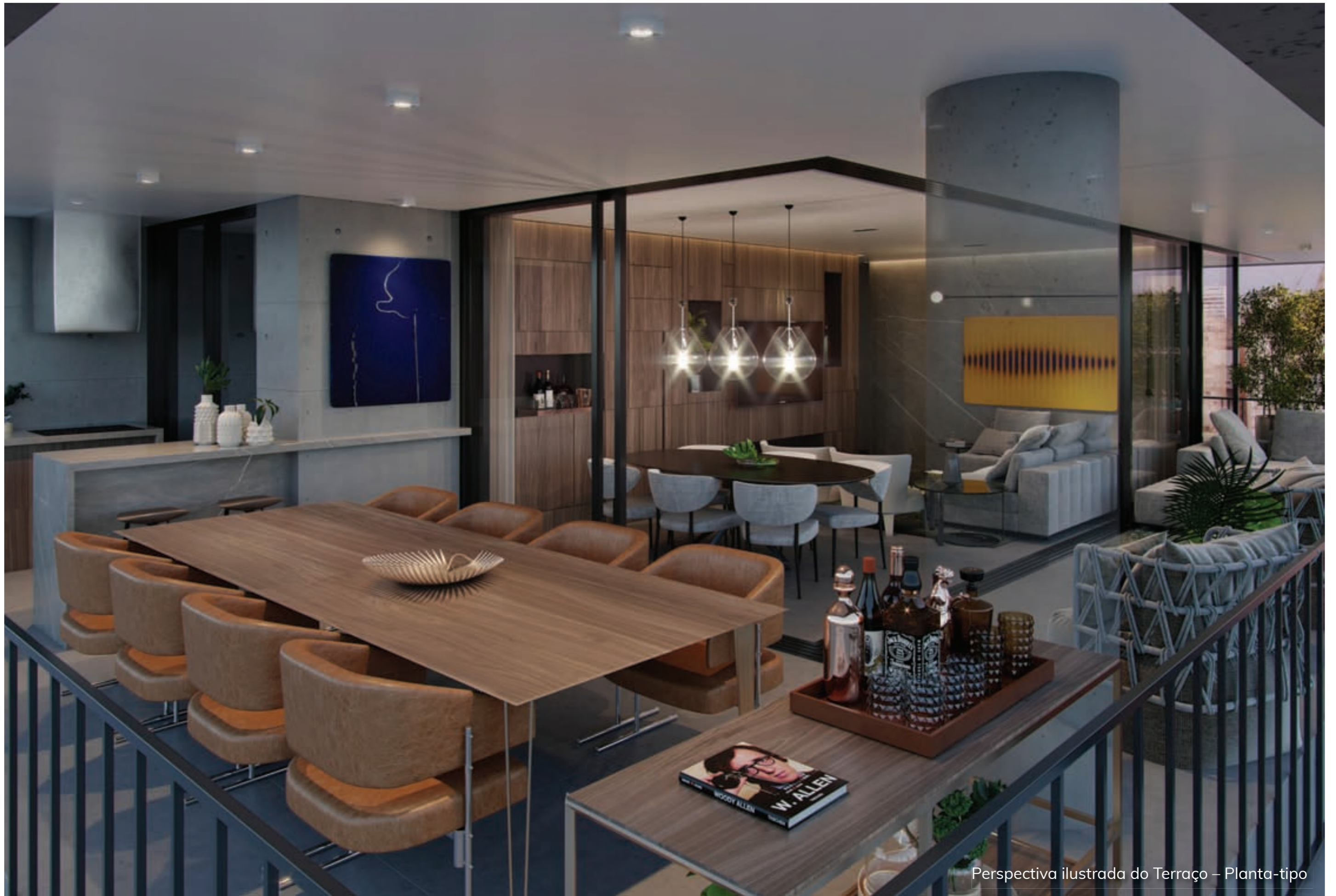
Perspectiva ilustrada do Terraço – Planta-tipo