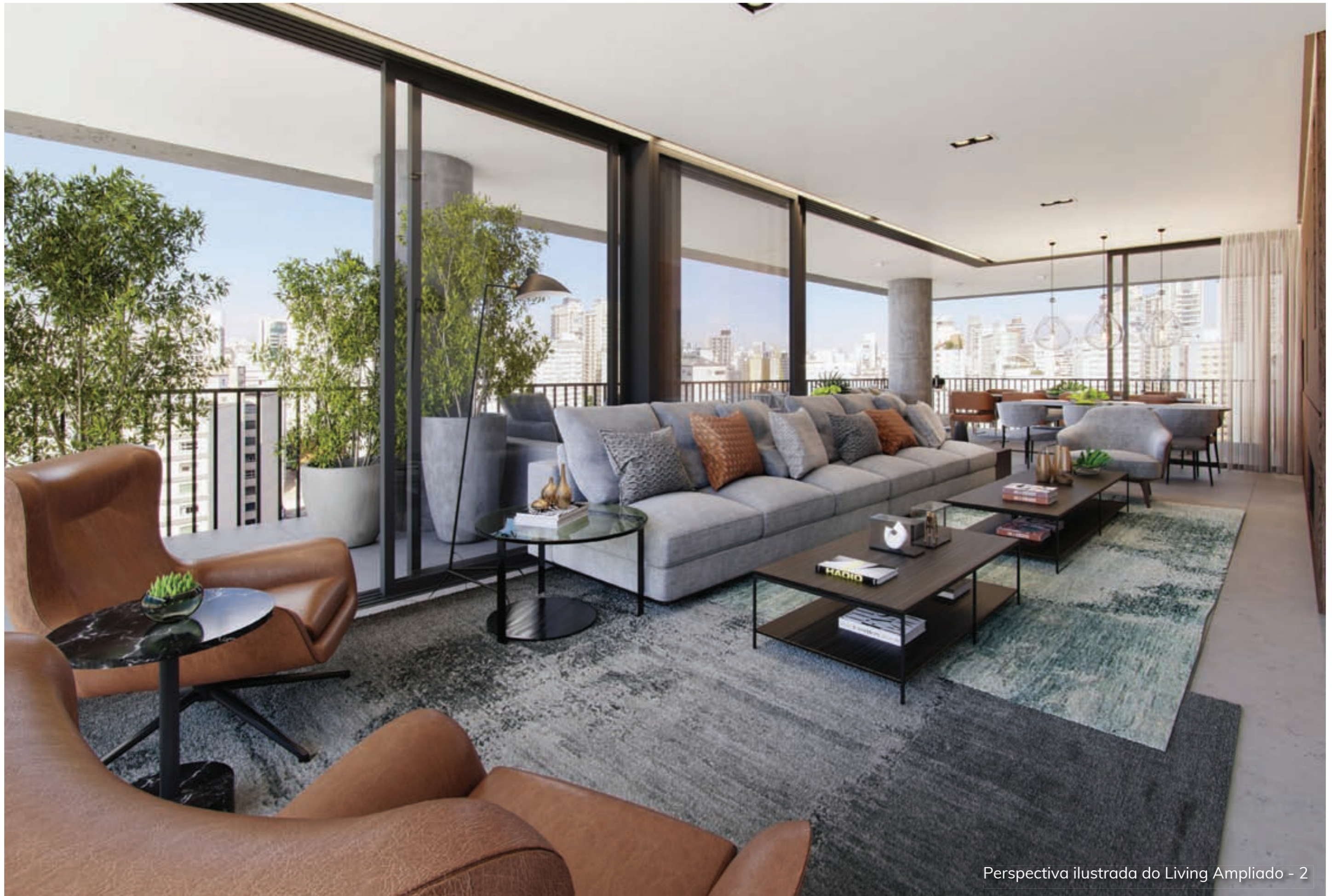
Perspectiva ilustrada do Living Ampliado - 2