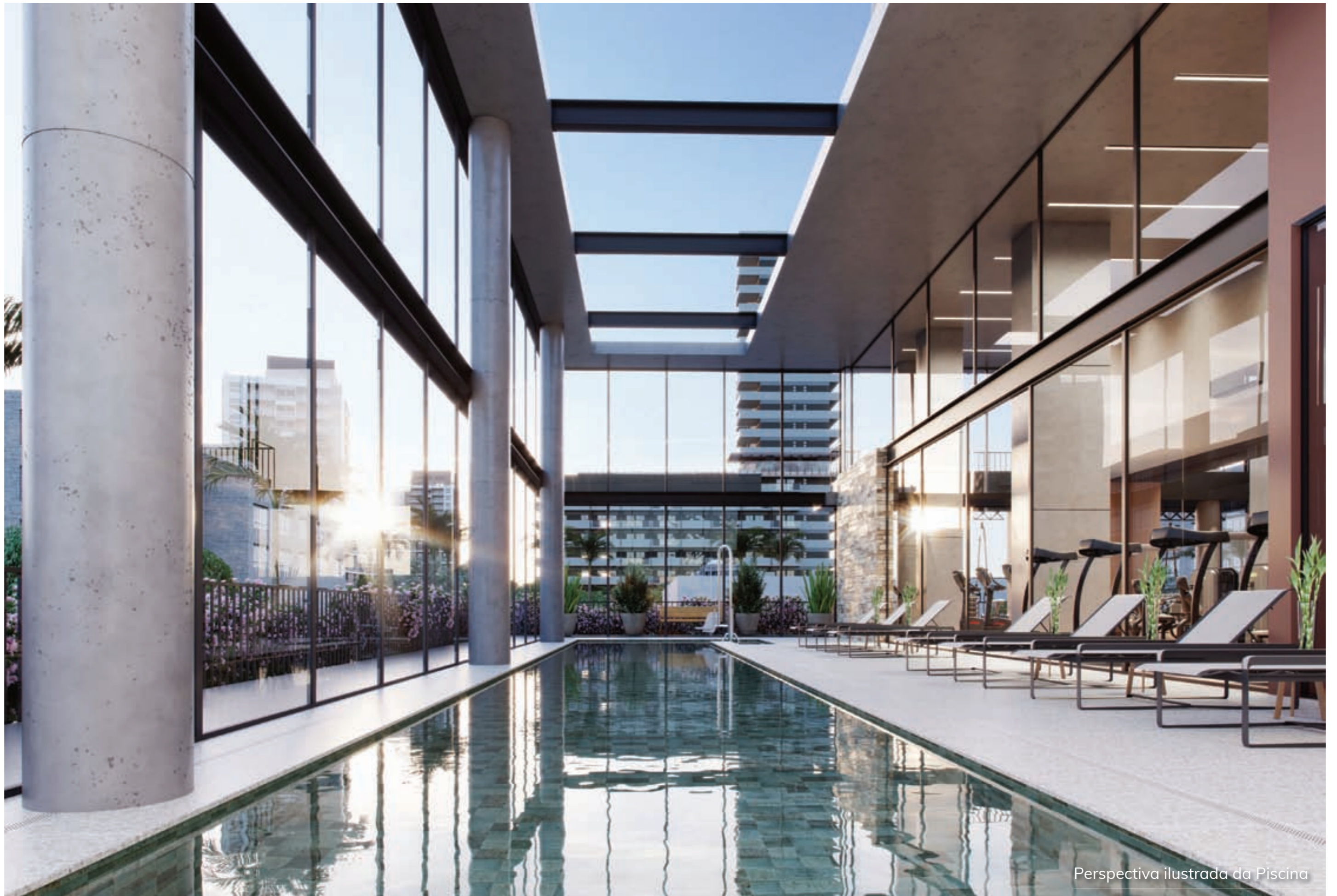
Perspectiva ilustrada da Piscina