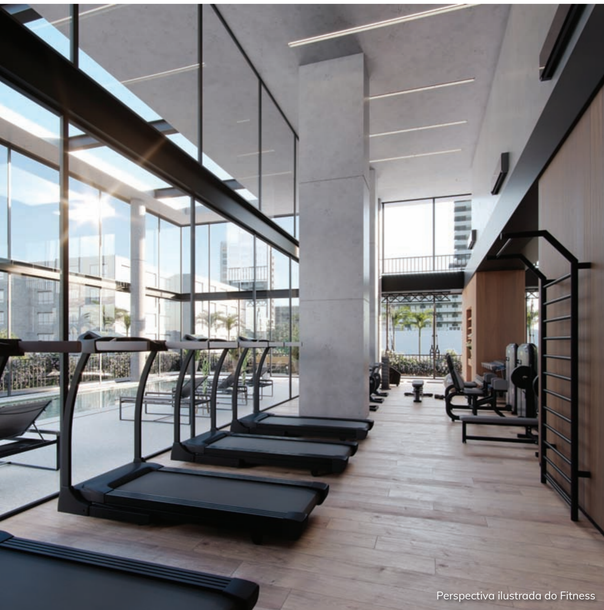
Perspectiva ilustrada do Fitness