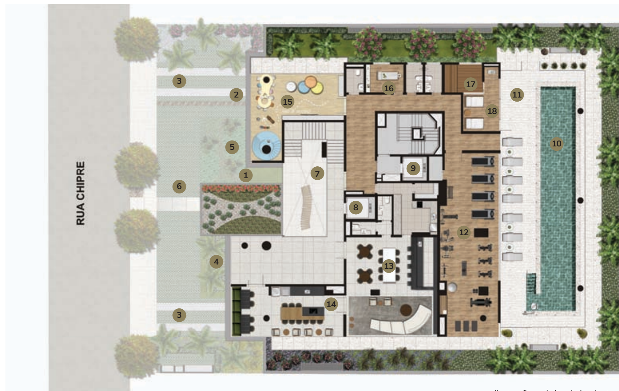
Ilustração artística da implantação