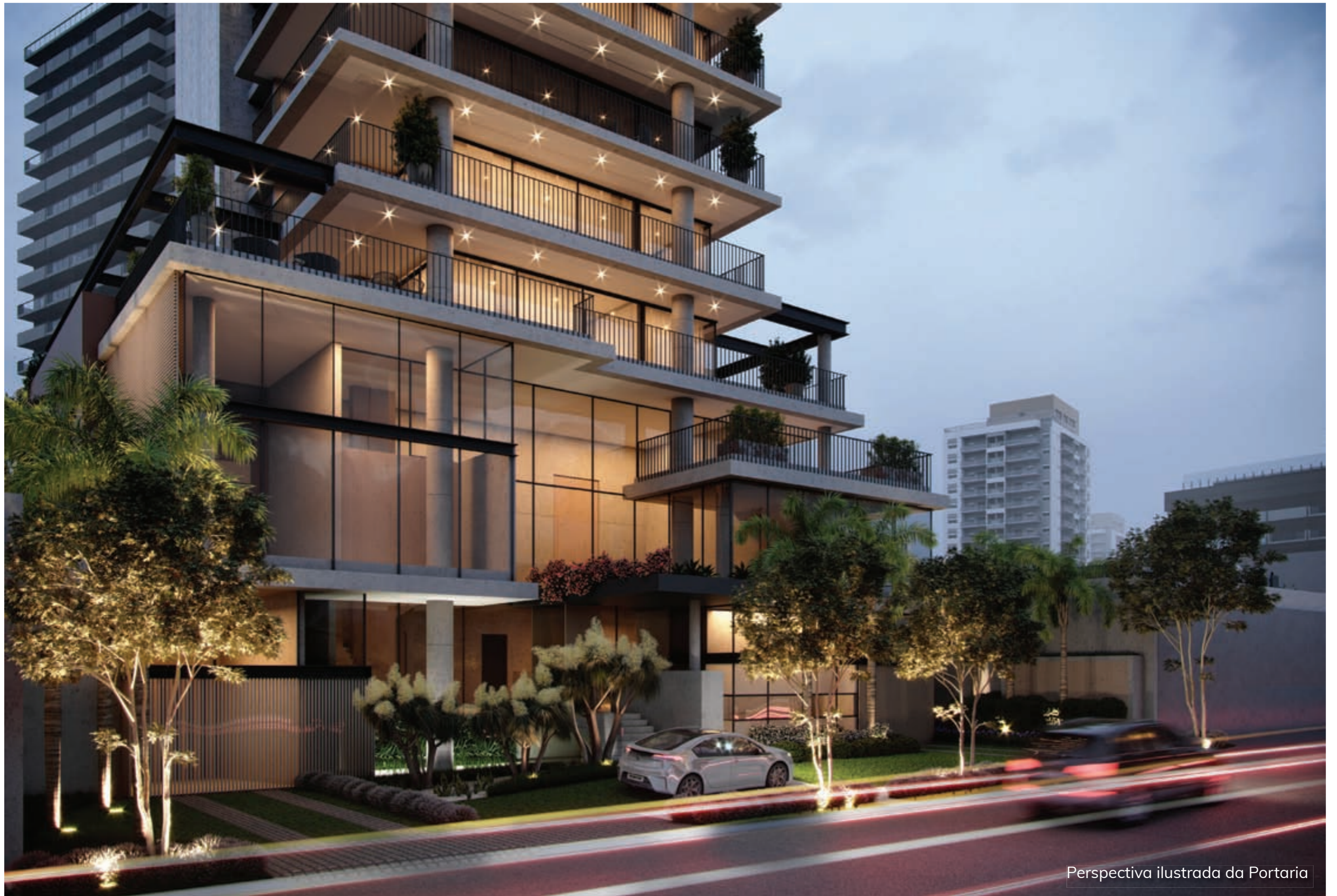
Perspectiva ilustrada da Portaria