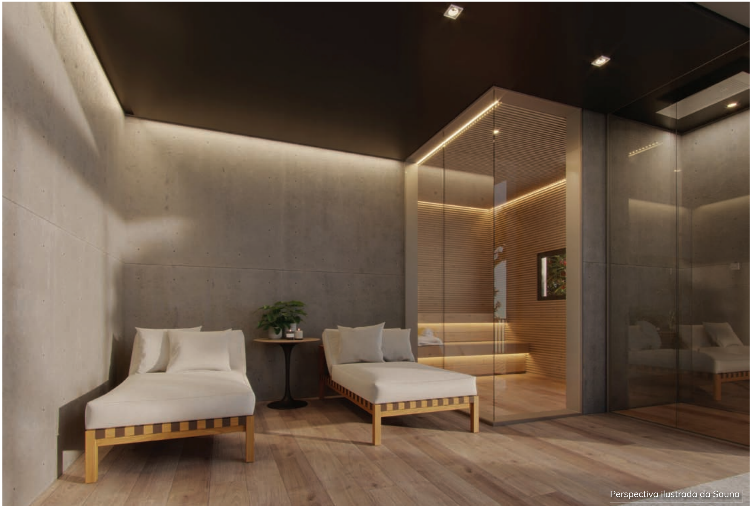
Perspectiva ilustrada da Sauna