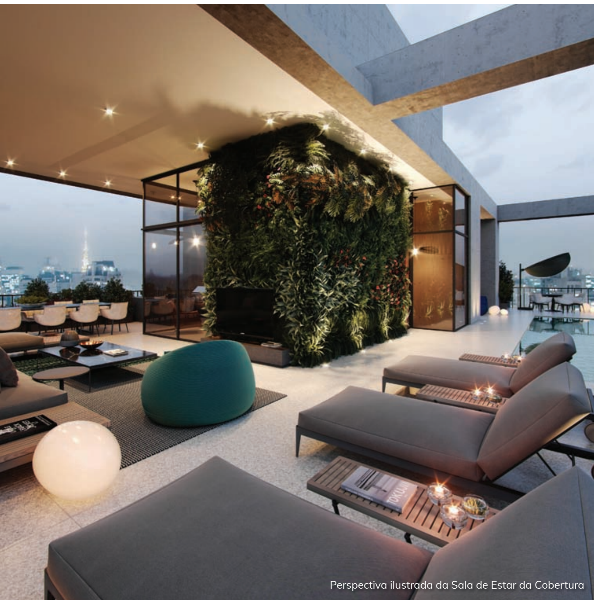
Perspectiva ilustrada da Sala de Estar da Cobertura