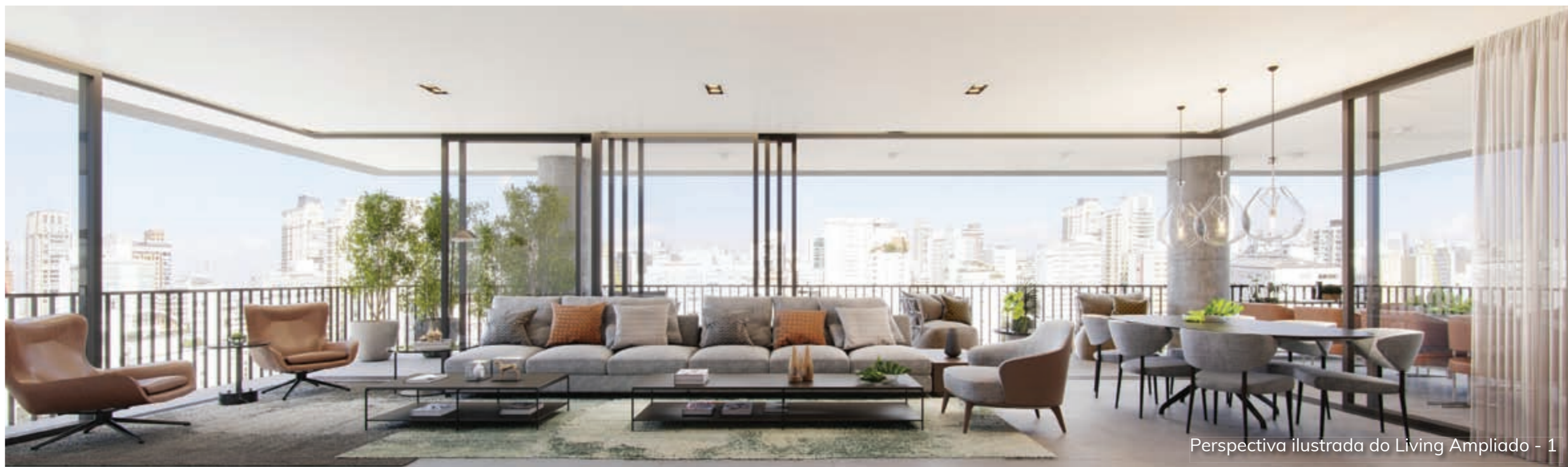
Perspectiva ilustrada do Living Ampliado - 1