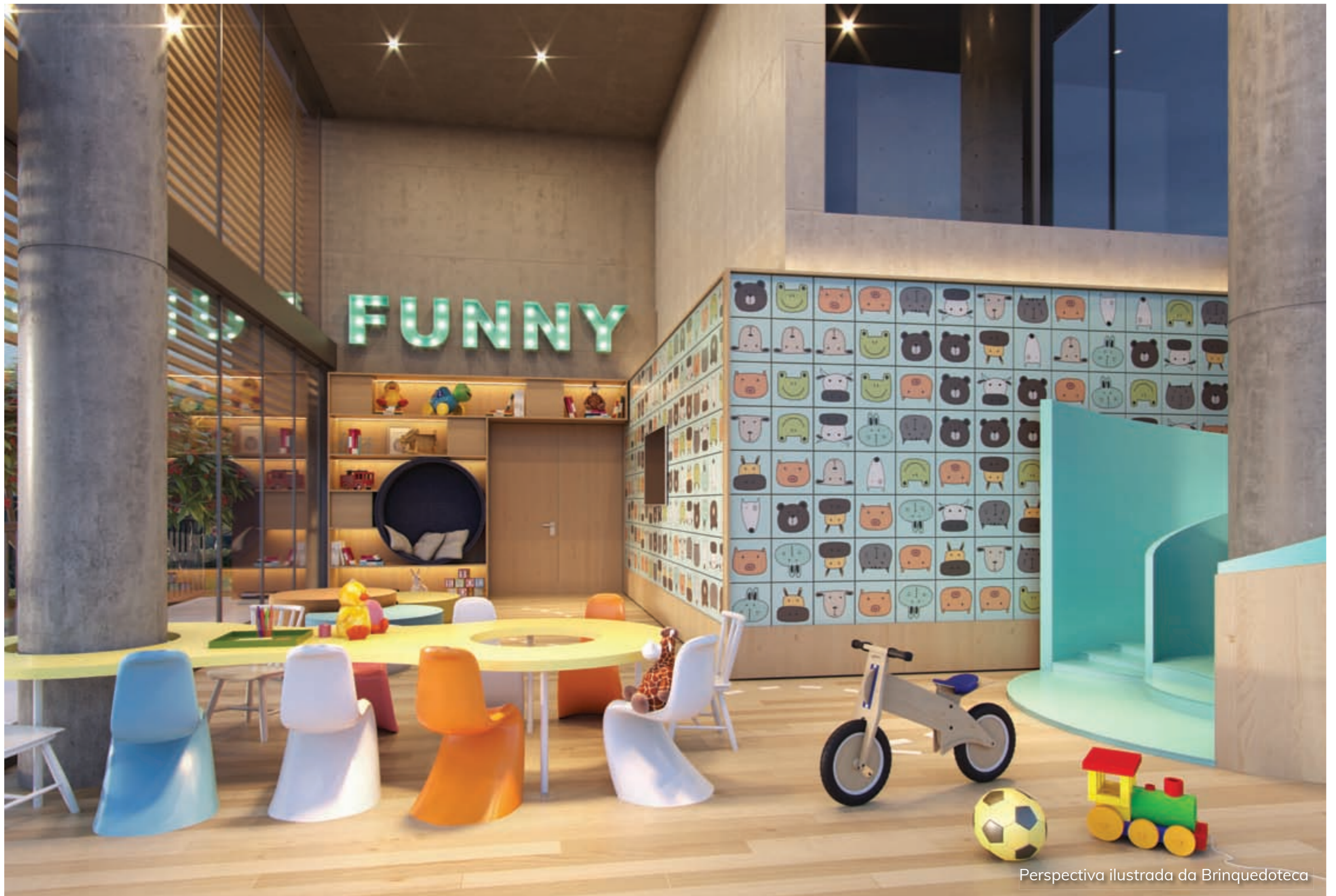
Perspectiva ilustrada da Brinquedoteca