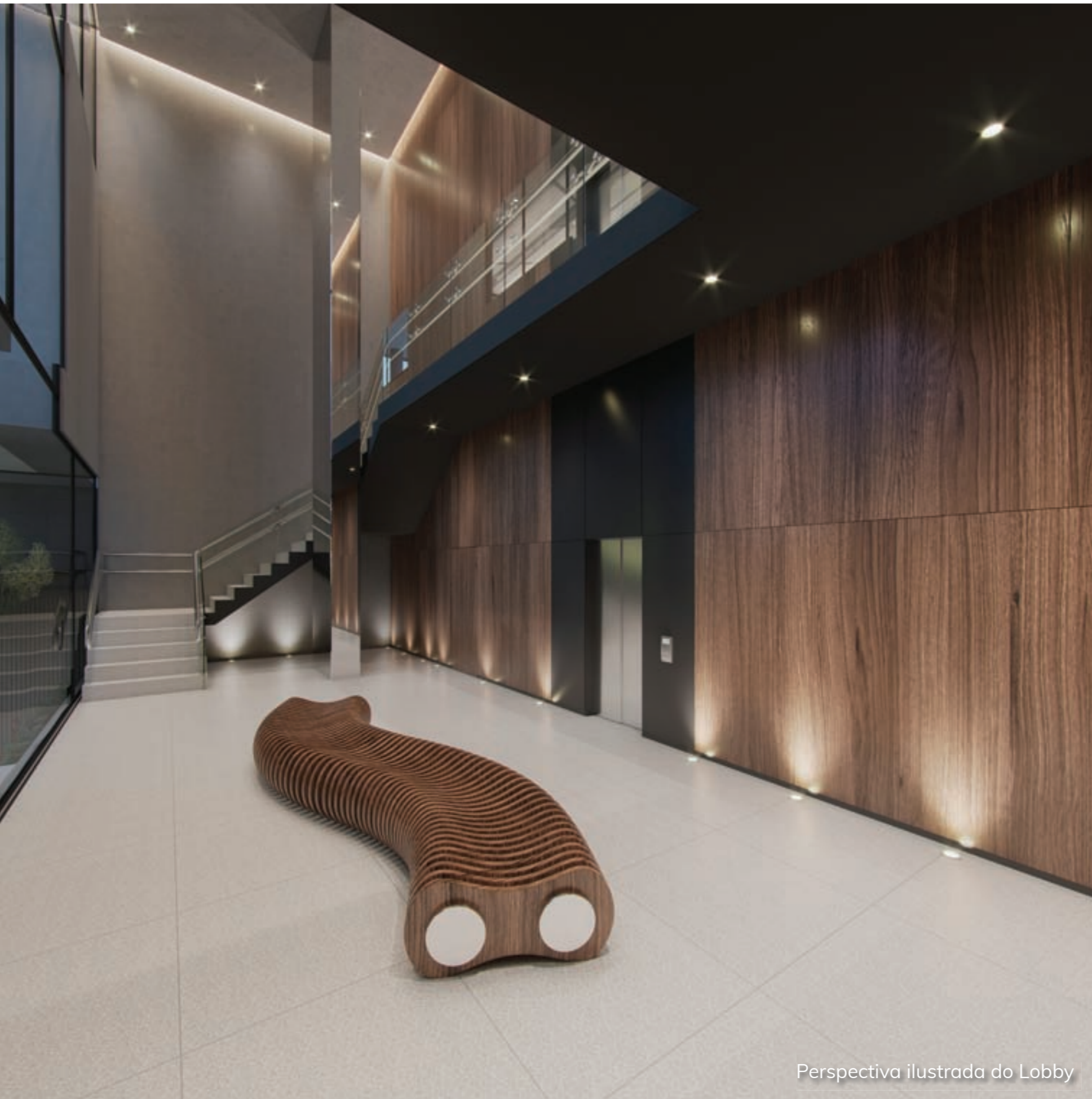
Perspectiva ilustrada do Lobby