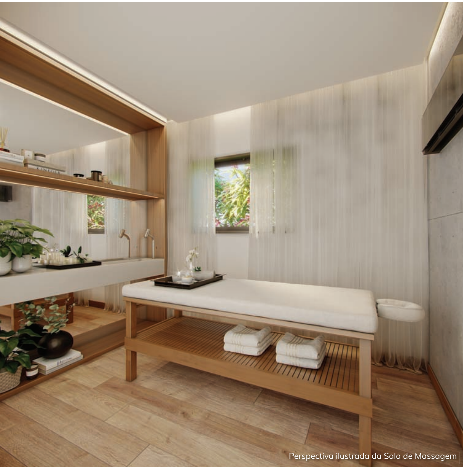
Perspectiva ilustrada da Sala de Massagem