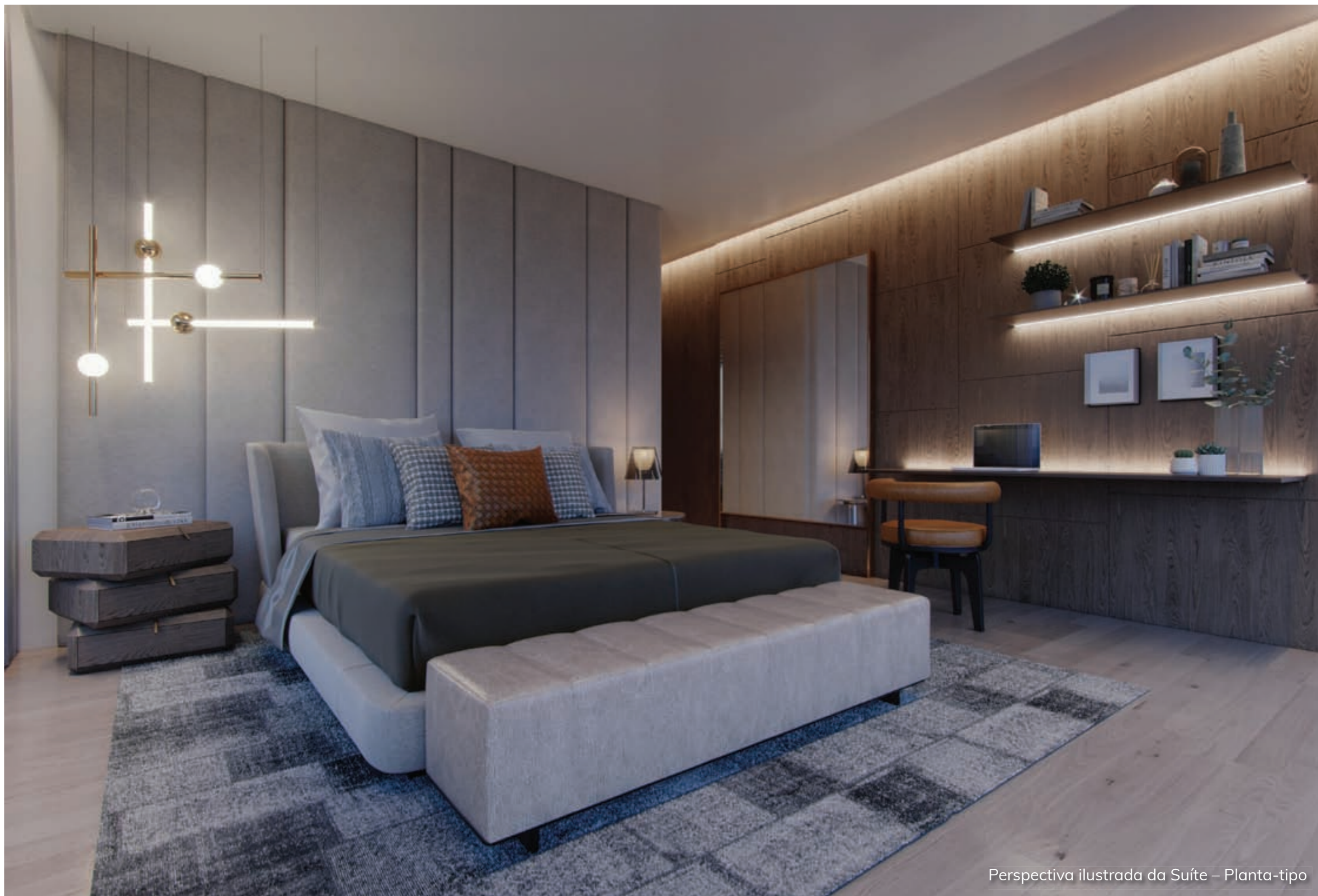
Perspectiva ilustrada da Suíte – Planta-tipo