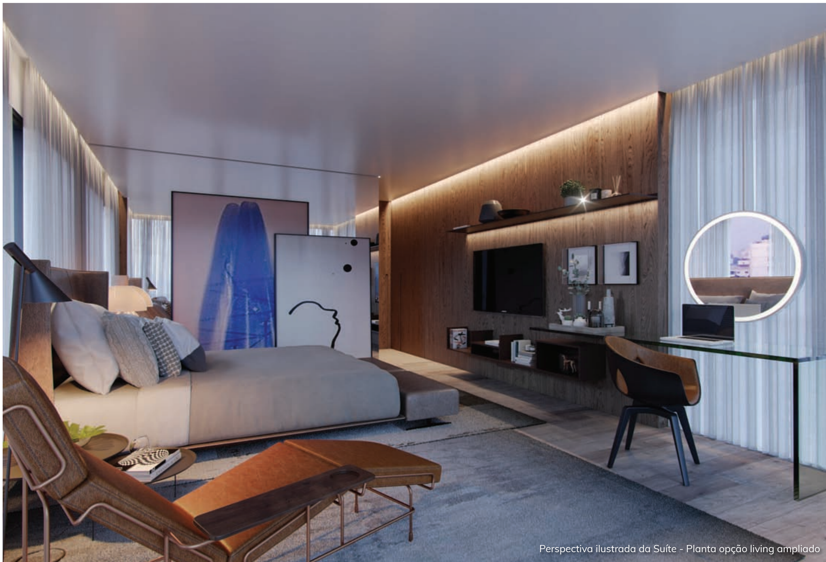
Perspectiva ilustrada da Suíte - Planta opção living ampliado