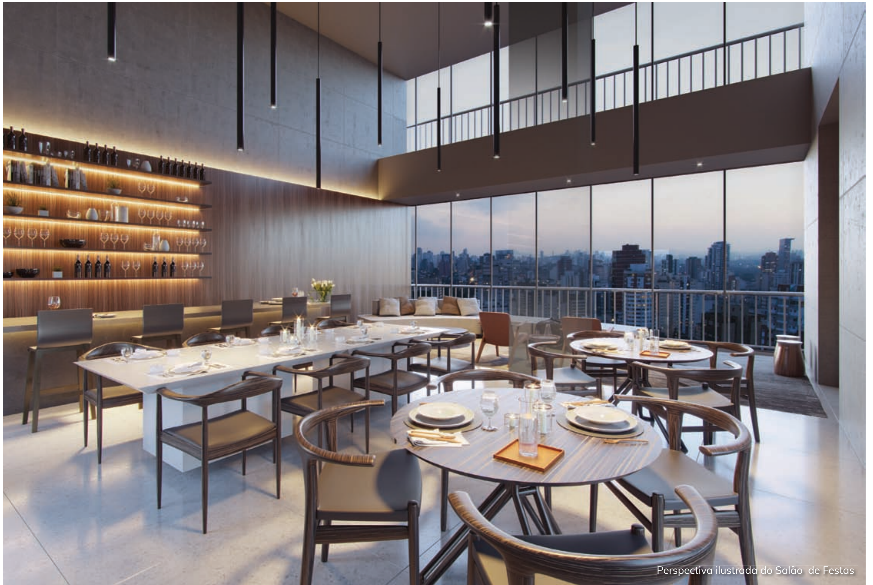
Perspectiva ilustrada do Salão de Festas