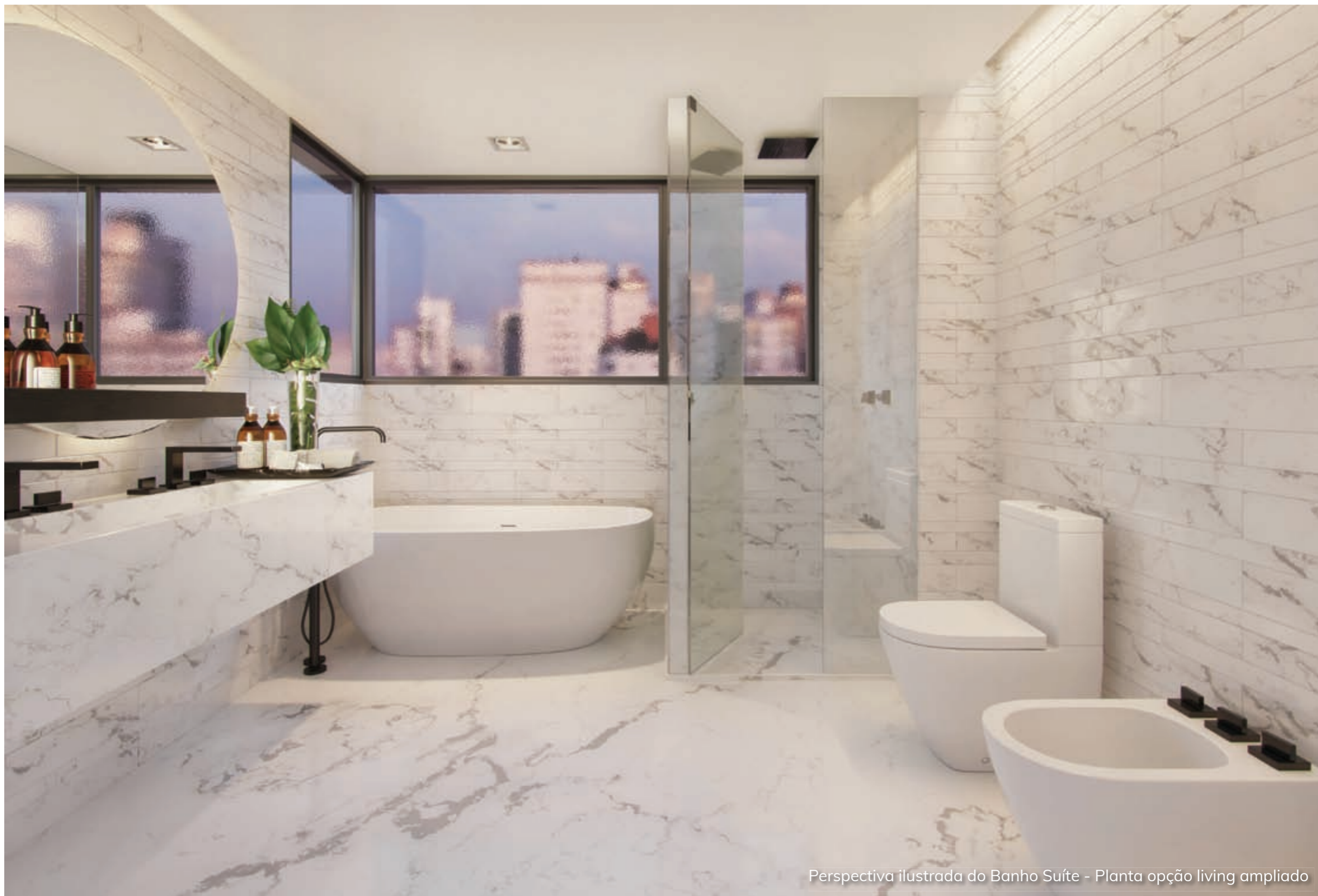
Perspectiva ilustrada do Banho Suíte - Planta opção living ampliado