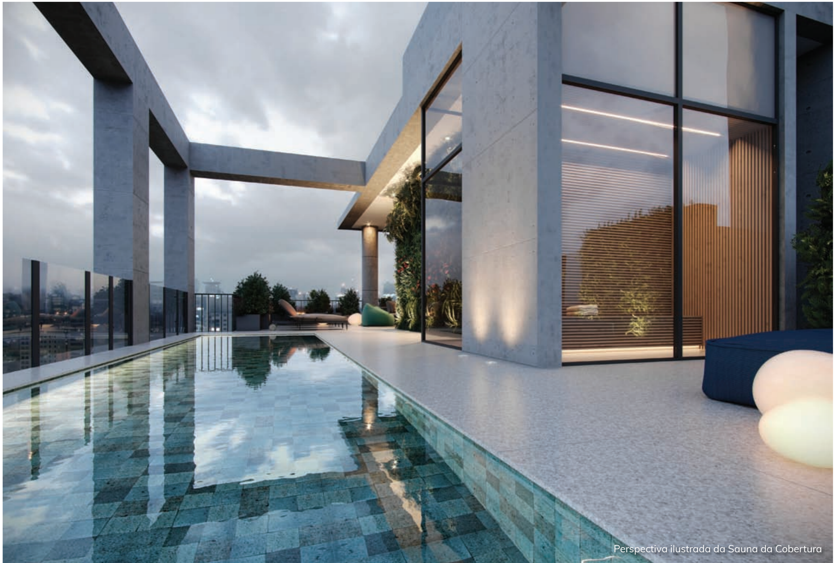
Perspectiva ilustrada da Sauna da Cobertura