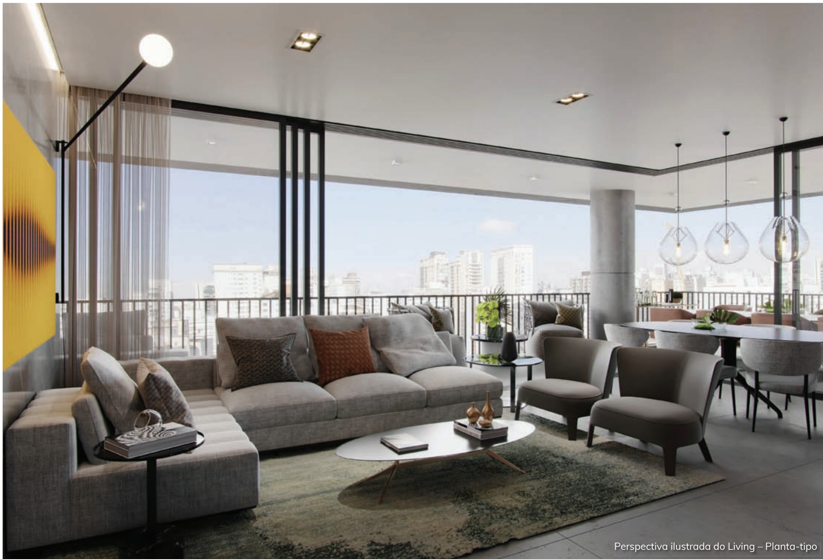
Perspectiva ilustrada do Living – Planta-tipo