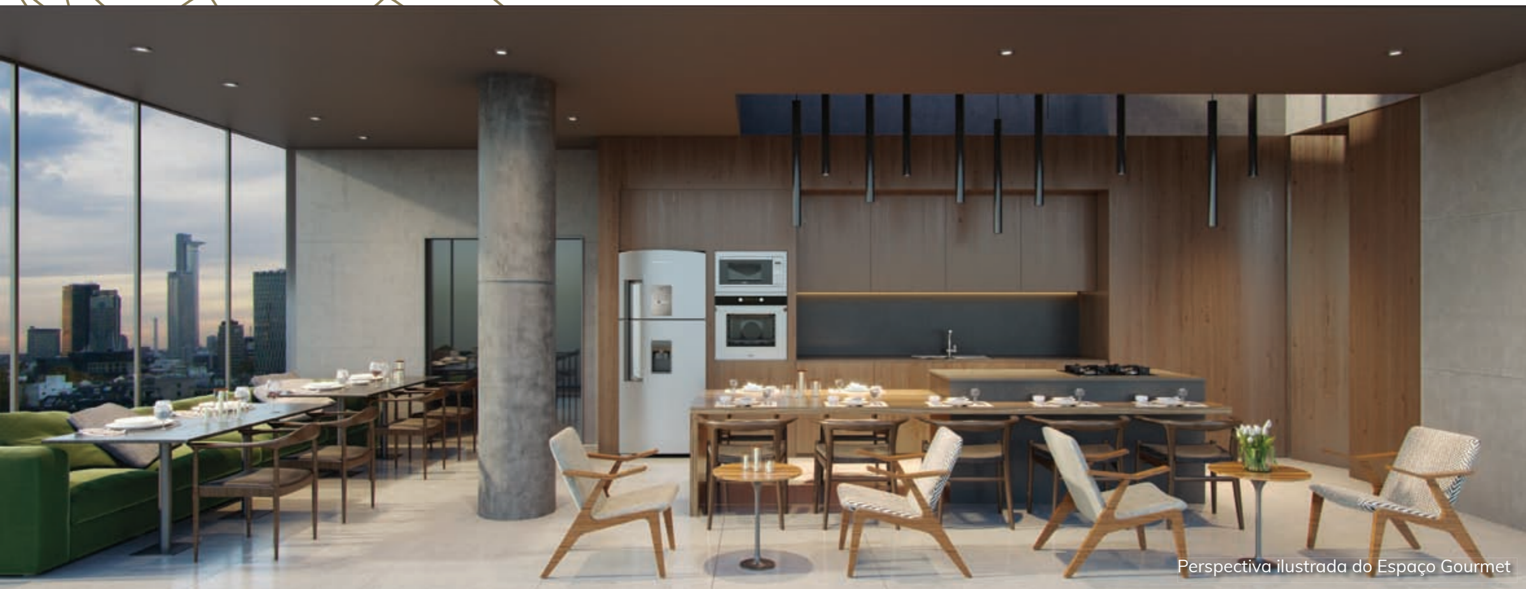
Perspectiva ilustrada do Espaço Gourmet