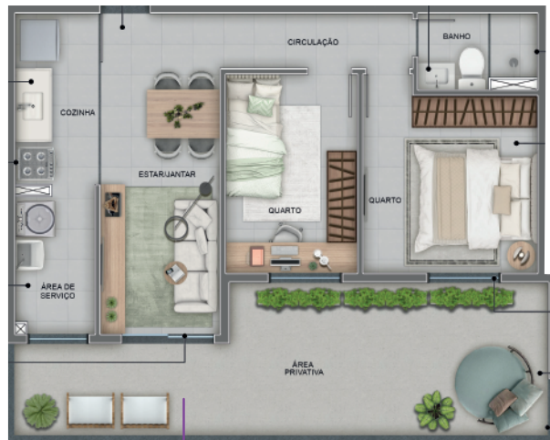
TORRE 02 - APÊ 05