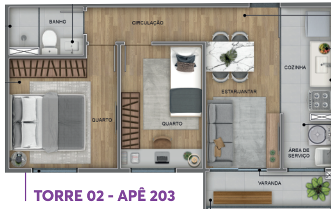
TORRE 02 - APÊ 203