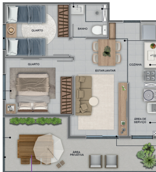
TORRE 02 - APÊ 07