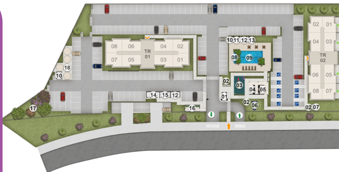
RESIDENCIAL COSTA DOS VENTOS- IMPLANTAÇÃO GERAL