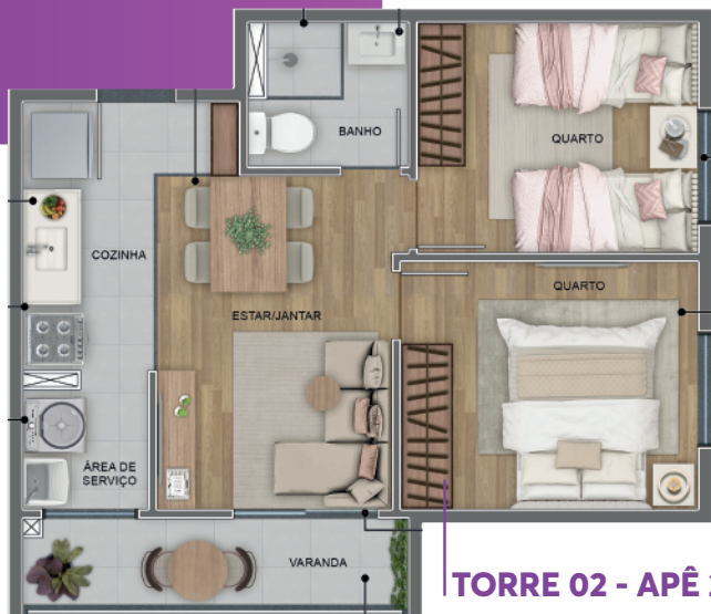
TORRE 02 - APÊ 201