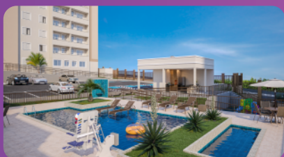
PISCINA ADULTO E INFANTIL